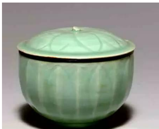
北宋龍泉劃花蓋碇

龍泉窯位浙江省西南部龍泉縣，故名。有謂龍泉青瓷始於晉代 (266-420)，但實際上興於北宋早期，盛於南宋，延續至元、明，迄清代康熙始式微，屬我國南方青瓷系統，歷來以粉青和梅子青釉色著稱。自北宋 (960-1127) 至康熙 (1662-1722)，前後七百多年，若自晉代起算，則製瓷歷史長達1700多年，乃我國歷史最長的一個青瓷窯系，不論從何算起，其歷史之長、生產規模之大，在中國陶瓷史上，可謂空前絕後。