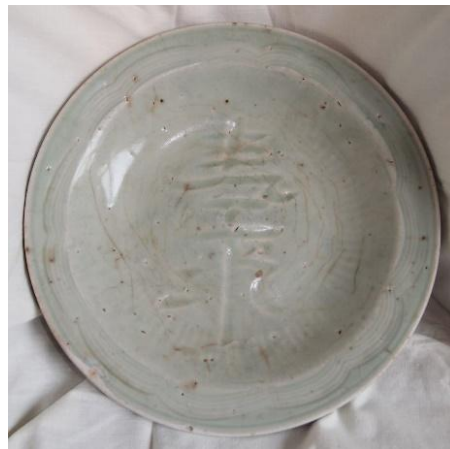
明龍泉刻花壽康大盤

龍泉青瓷，單一瓷品，單一窯系，單一窯區，燒了七佰多年。龍泉窯的壽命，比幾個朝代加起來還長，真可謂異數。朝代更替，但承傳不斷，歷宋元明清而品質、表徵、設計、技術卻一脈相承，幾百年的技術和藝術結晶，先賢已濃縮在眼前的青霞碧影中了。