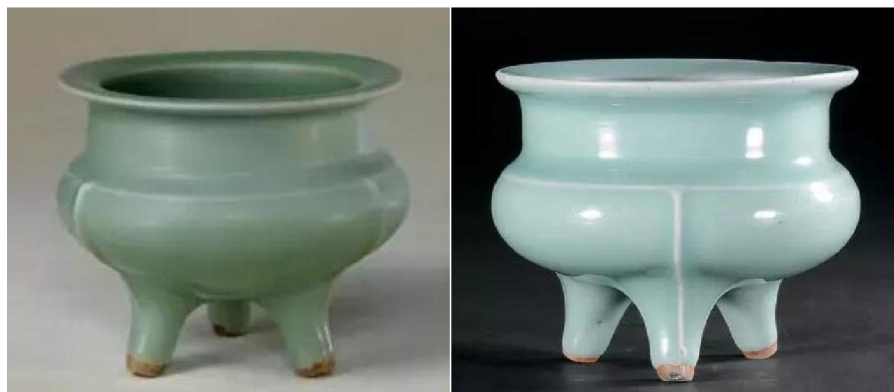
北宋(左)南宋(右)龍泉鬲式爐

本來北宋龍泉窯用石灰釉，它的特點是高溫下粘度小易流淌，因此這類釉一般顯得比較薄而透明。但南宋中、晚則改用石灰鹼釉，特點是高溫燒製時粘度大，不易流淌，這樣便可使釉層施得更厚，更飽滿。工匠也採取多次施釉，反覆入窯，多次燒結的複雜工藝，使釉層變得更豐厚，色澤更沉穩。加上斯時已能熟練掌握了還原氣氛的技術，遂創造出粉青、梅子青、豆青、米黃、烏金等各種釉色。