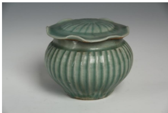
元龍泉窯青釉荷葉蓋罐

我二十年前在廣州文物公司見過幾隻龍泉瓷品，有一碗於碗心刻花「河濱遺範」，另一盤則刻「金玉滿堂」於盤心。雖然胎、釉、色的表徵與北宋龍泉一樣，但這些卻是南宋早期龍泉的製品，可幸當時有購下，今已少見。