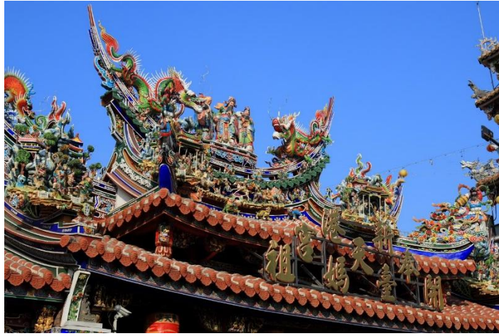
新港媽祖廟屋脊交趾陶塑