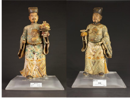
台南慈濟宮葉王交趾陶作品「加官、晉祿」

談交趾陶，不能不提葉王 (1826—1887)，葉王即葉麟趾、台灣嘉義人，其父葉清岳本為陶工，是故葉王家學淵源，技藝出眾，塑像人物，栩栩如生；為第一位臺灣出身的交趾陶大師，有「臺灣交趾第一人」之譽，其作品曾遍及全台。