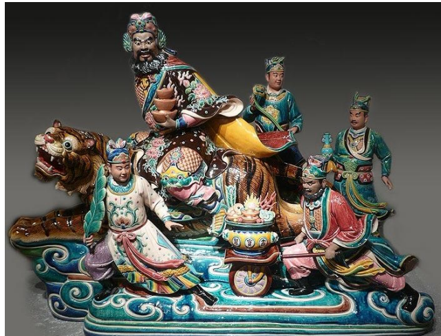
現代交趾陶大師作品

大約在1980年期間，在台灣嘉義有些古董商人將廟宇翻修時拆卸的交趾陶俑買進，在古董市場上流通，讓交趾陶開始轉化成可收藏的藝術品。而在1980年當年，就有五十六件葉王原作被盜，但卻沒有在本地市場出現；後來在2003年時輾轉從海外購回。所以有一段時期，凡是從台灣出境旅客行李內攜帶仿製交趾陶紀念品的，都一律檢查，以防國寶出境，而當時真有不少旅客被扣，直至查明確實是現代仿品始放行。