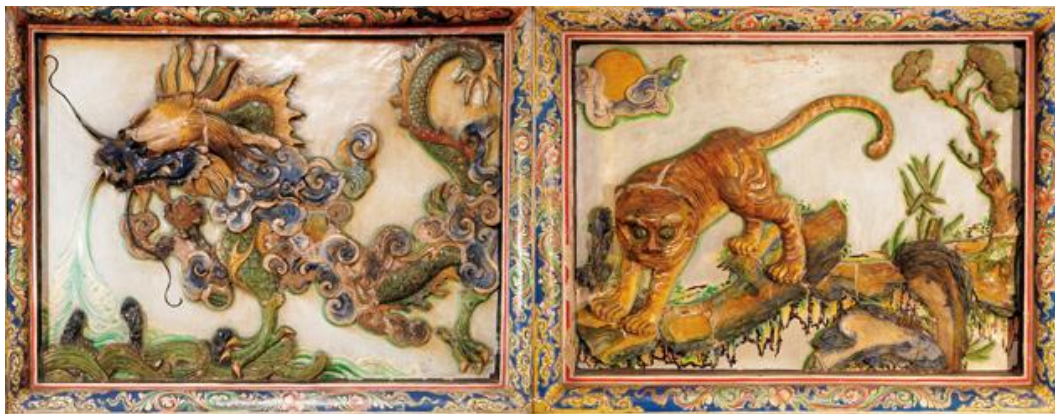
塑於1920年之艋舺龍山寺交趾龍虎壁雕塑

交趾陶是中國南方與台灣傳統廟宇和大宅的屋頂和壁堵裝飾，源於唐三彩，或更像我國廣東的「石灣公仔」，是一種低溫彩釉軟陶，製作步驟繁複，全用手塑，造價頗高。除在台灣各大廟宇，如新港媽祖廟、南鯤鯓代天府、艋舺龍山寺等；和民宅如台中潭子摘星山莊等；都以保存完整的交趾陶著名。我所見在嶺南，如建於光緒十四年 (1888) 廣州的陳家祠，屋頂上也五彩繽紛，陶塑花鳥、樓閣、動物和人物交織的吉祥寓意和民間故事。