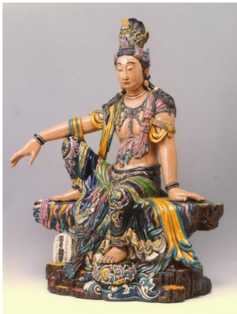
嘉義市交趾陶文化館陳列品

現在台南學甲鎮的慈濟宮，在全台灣收藏葉王的交趾陶作品數量最多，其起因乃於咸豐十年 (1860) 重修慈濟宮時，聘請了交趾燒大師葉王做壁堵及屋頂的裝飾。葉王當時花了兩年多的時間，創作了數百件以民間故事為題材的作品，安放於廟頂中脊到正殿內壁堵。