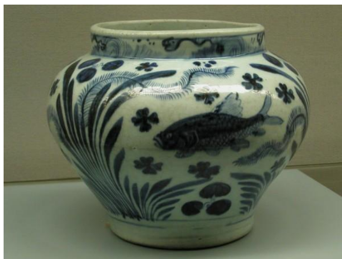
東京國立美術館藏元青花魚藻紋罐

另外普通人無法接近，甚至無緣過目的元青花，在歐洲、香港、日本、菲律賓、印尼、泰國、馬來西亞、印度、中國等地，確認又流傳有序的館藏及私人收藏，聞不多於 60 件。至於其他未知的私人收藏，在信念上應該尚有，但相信為數不多，而證實為真品者可能更少，否則不會數十年來杳無披露。