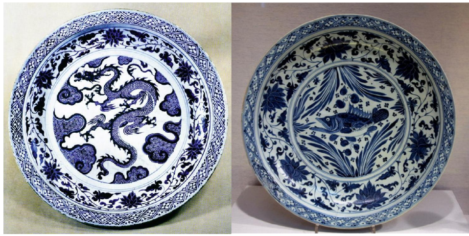
伊朗博物院(左)及大都會博物館藏元青花大盤

元青花生產基地的考古發現，是景德鎮湖田考古的一個重要收獲，元代窯業堆積層主要分佈在南河兩岸的臺地上，產品以卵白釉瓷、青白釉瓷、黑釉瓷為最多，也有少量青花瓷。所產青花，據測定絕大多數為高鐵低錳的進口「蘇麻離青」料。生產的分佈狀況，在南岸以大盤、罐、瓶為主，與伊朗、土耳其的存世品一致；而北岸則以高足杯、折腰碗、小酒杯為多，與菲律賓一帶出土的相同。據考古工作者分析，湖田窯的元青花，都不會早於十四世紀，也就是說它的盛燒期並不是縱貫整個元代。另一個情況是湖田窯出土的元青花瓷片非常少，在南河北岸一殘窯北側的 62 平方米、厚達 3.4-1.6 米的遺物堆積層中，青花殘片僅占 0.45%。由此可見，當時的青花器，是處於一種「有需要才燒製」的狀態，總體的燒造量並不大，佔元代景德鎮製瓷總量的份額也不多。當時元青花除供皇室使用外，部份亦供內用，餘皆外銷。相信這便是存世元青花，多藏國外博物館的原因了。