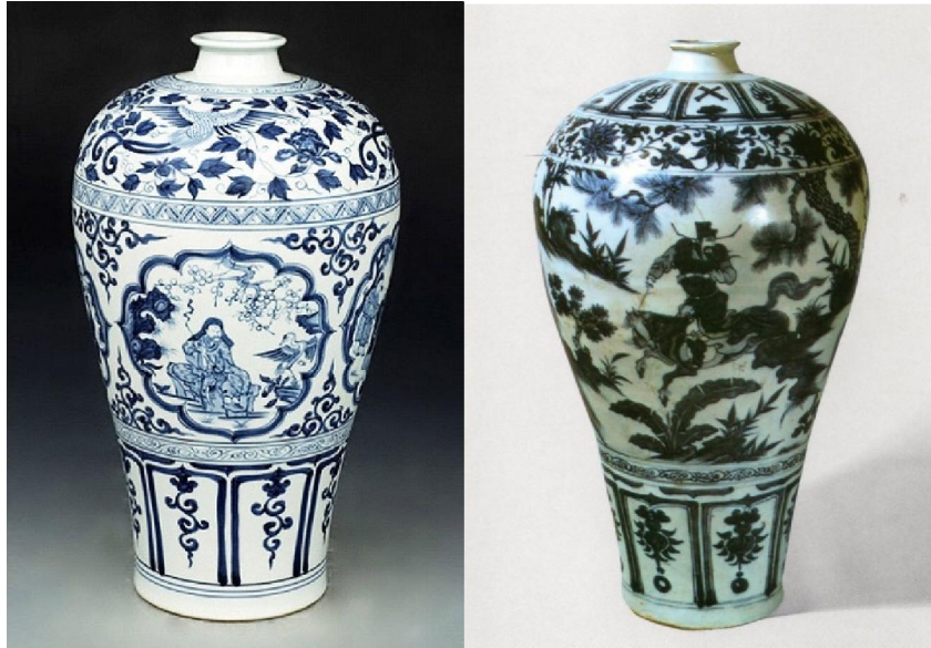
武漢博物館(左)及南京博物館(右)藏元青花梅瓶

of Art) 1 件；印尼椰加達國家博物館 (Museum Nasional) 1 件。另日本博物館藏約 30 件。法國博物館藏 5 件。