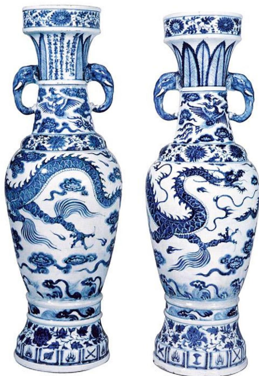
大維德基金藏至正型青花龍瓶

今日瓷友評鑒元青花，大都基於有三大要素，一為景德鎮浮梁瓷局製品，二為青料使用進口「蘇麻離青」，三為瓷土使用「麻倉土」。