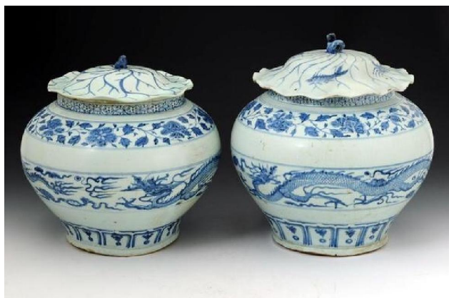
高安博物館藏元青花蓋罐

在 1975 年於湖北黃梅縣西池窯廠元代墓葬中發現了一件青花牡丹紋塔式蓋瓶，隨之出土的一張「延佑六年」地券，旁證了此瓶最遲於延佑六年(1319)生產，相比元至正十一年要早幾十年。這是當年唯一的一件紀年證據，所以是否可假設使用麻倉土作生產原料生產的元青花，是否由 1319 年左右至 1351 年左右這大約 33 年內的事呢？汝窯開窯二十年，生產單一產品，如今確認的只有六十餘件；元青花是景德鎮窯其中一項極不重要的產品，只佔二百分之一左右的產量，窯期三十三年，存世百數十件，也不算不合理，未知瓷友以為然否？