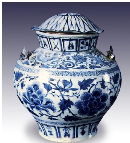
泰國出土元青花蓋罐

中國藏元青花者則有：江西省高安博物館藏 19 件；台灣鴻禧博物館藏 6 件；河北省博物館／北京故宮博物院／武漢博物館／南京博物館／山東博物館／廣省博物館／上海博物館／無錫博物館／首都博物館／安徽博物館／山西博物館／包頭博物館等合共 25 件。這些都是我們有機會逛博物館時可以欣賞到的。