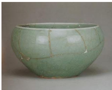
宣德地層出土仿柴窯鉢

文字上有關柴窯的著作，大都成於明代，除上述的《格古要論》外，尚有《新格古要論》、《事物紺珠》、《清秘藏》、《五雜俎》、《玉芝堂談薈》、《博物要覽》、《夷門廣牘》、《瓶花譜》、《長物志》、《留青筴》。清代則有《古窯器考》、《陶說》、《南窯筆記》。民國則有《古董辨疑》、《竹園陶說》、《柴窯考証》等。內容都大同小異，不外三點，一宋代已稀罕，二天青色，三現已不見。今天能見到最接近想像中的柴窯，大概只能從圖中之一隻從宣德地層出土的仿柴窯天青鉢，捕捉一點「天青色，滋潤細媚，有細紋多，粗黃土足」的印象吧。