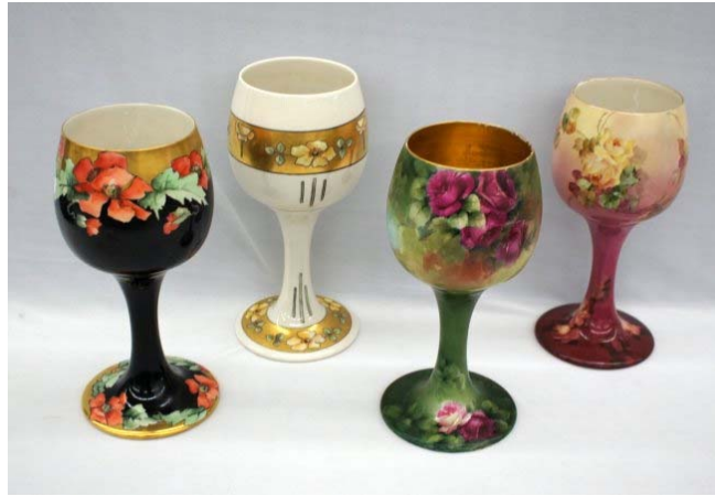
19 世紀威里士窰描金手繪 30cm 高足杯