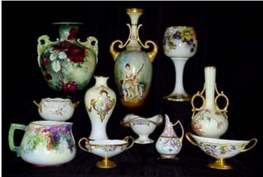
各式美國伯利克瓷精品