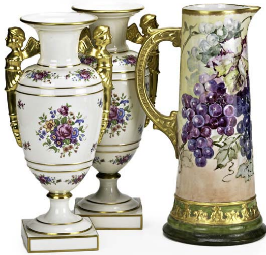
2012 年拍賣李諾士窰伯利克瓷三件