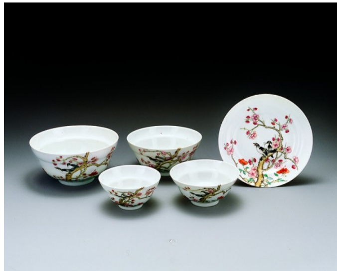
苏州博物馆藏居仁堂粉彩瓷

但民國瓷器與前朝相比，雖同樣潔白、細膩、瑩潤，但卻稍具現代氣息及特徵，胎骨細白，燒結度高，胎釉結合緊緻，造型規整。但因洪憲瓷真品與仿品都出自同一年代，同一產地，甚至可能同一技術配套，要辨別確有難度。但仿品雖云精仿，始終是「克隆」，色彩一是過於濃艷，一是過薄淡；畫工因為克意摹倣，有些筆觸顯得不流暢，有美術基礎的瓷友，往往細看即可分辨一二，與真品相比，總是差了那麼一點點。近年洪憲瓷身價直線上升，市場見大量「居仁堂」款瓷器，器形、紋飾、釉彩、釉色俱佳，唯畫工更欠功力，匠氣十足，瓷友拍場舉牌，宜慎之！