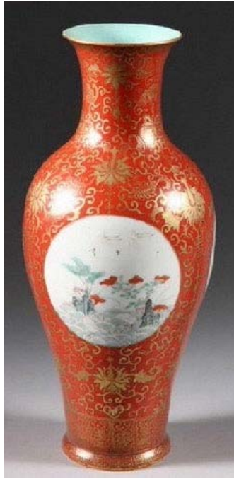
矾红描金開光觀音瓶