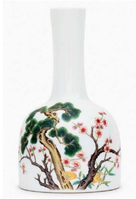
琺瑯彩三友纹搖鈴尊