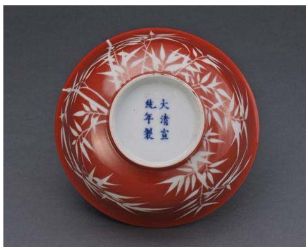
宣統紅彩留白竹紋碗