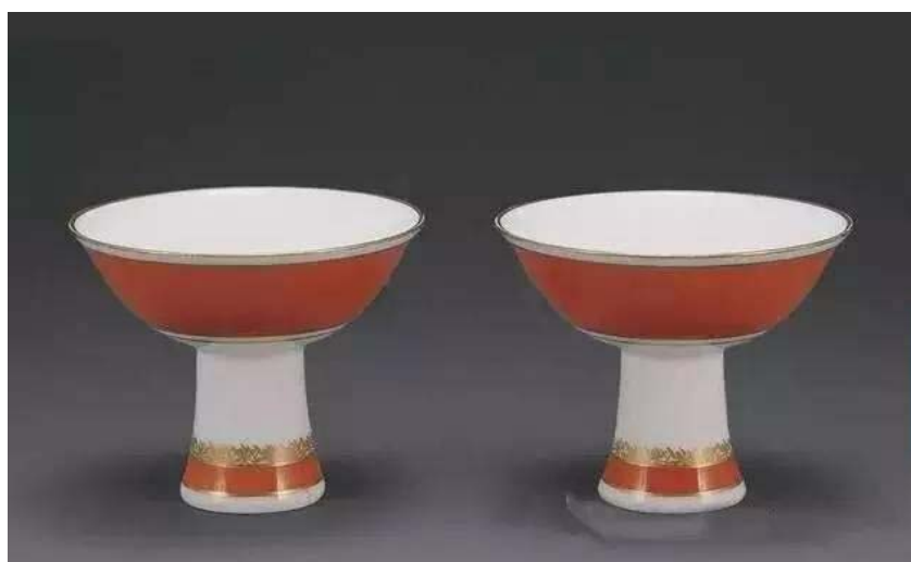
康德四年紅彩高足杯