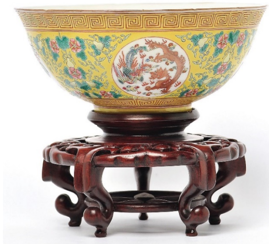
光緒黃釉龍鳳紋碗