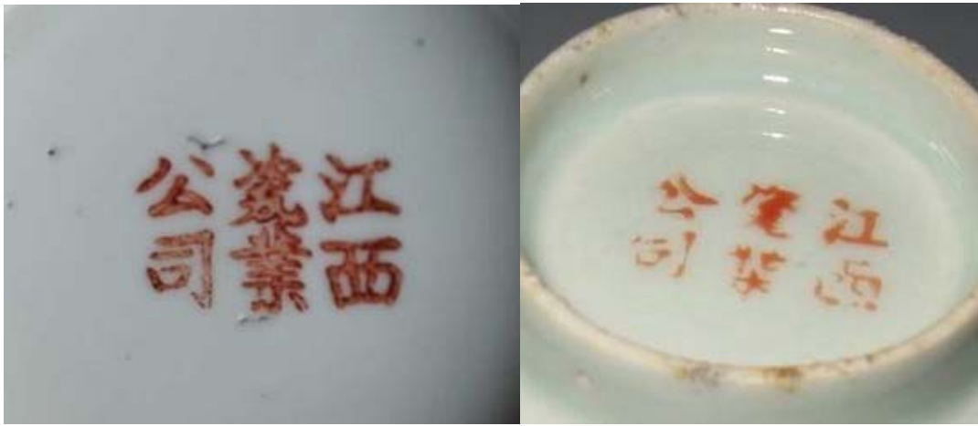
市場所見各種江西瓷業公司底款