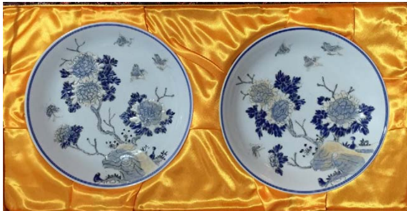
江西瓷業公司粉彩花鳥紋盤一對