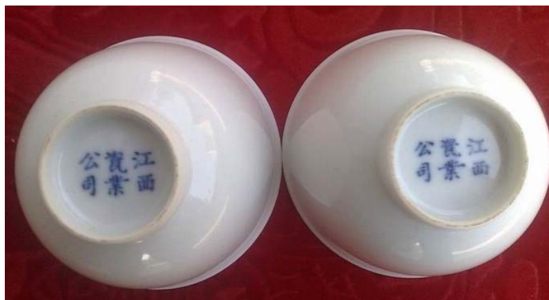
江西瓷業公司機製白瓷杯一對