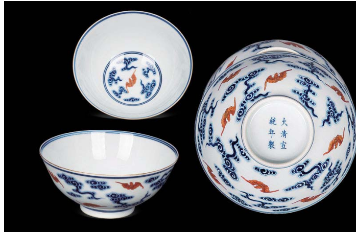
江西瓷業公司宣統雲蝠紋碗