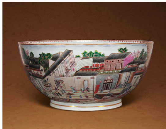
廣彩廣州十三行圖大碗 - 2012 年嘉德 - 51.75 萬元