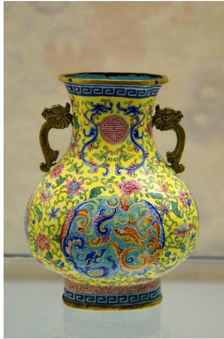
香港藝術館廣彩纏枝花卉雙龍耳瓶