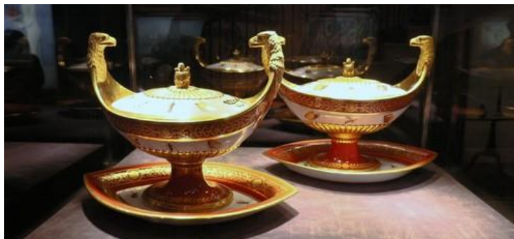
拿破崙一世特製糖盅

反觀同時代的景德鎮，1760年時是乾隆時代 (1736-1796)，參看乾隆八年 (1743) 由唐英編製，宮廷畫師孫祜、周鯤、丁觀鵬合繪的《陶冶圖說》二十圖所示，各種工序，例如練土、練灰、配釉等以下各項工序，均以人力完成。應用畜力的，圖中亦罕見。至於骨瓷，當時在景德鎮更是聞所未聞。從表面證據判斷，有理由相信當時英國瓷器的品質，絕不下於景德鎮。而從實物判斷，其瓷質、彩釉，繪工，形制、細節，更有過景德鎮官窯而無不及。今天，英瓷大老韋奇伍德瓷器依然是世界最高端的瓷器之一，高端市場基本都是歐洲瓷窯，日本也佔有一席之地。但反觀景德鎮，迄今都沒有什麼代表性的瓷器品牌，確讓人擲筆三嘆。