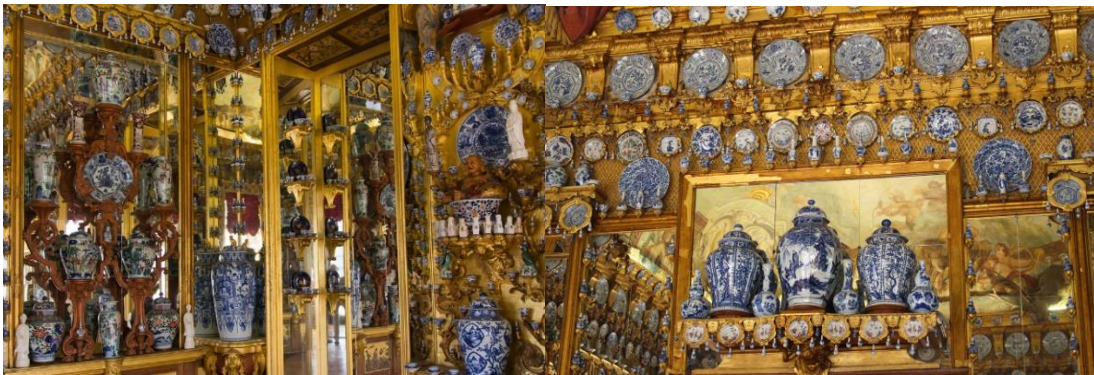
德國柏林夏洛滕堡瓷宮不同角度近景

代爾夫特青花以西洋筆法繪中國人物、翎毛、走獸，又採用歐洲風景、聖經故事、西洋花卉、西洋文學等題材，遂形成一種獨特的風格。今天是不算太貴的價錢購得的古重代爾夫特青花，當時實際上是非常高級、價昂而不易得的藝術品。後來受代爾夫特青花的啓發和影響，倫敦(London)，布里斯托(Bristol)，林伯芙(Lanbeth)，諾域(Norwick)，修獲(Southwark)等地也相繼發展相對較便宜的青花陶器補充了第二市場的渴求。