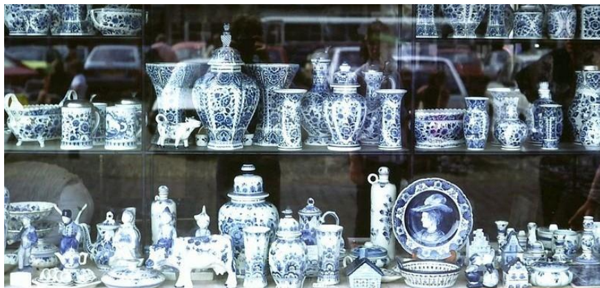
各式代爾夫特青花瓷

我過去談外銷瓷，亦有斷斷續續談過歐洲各國和瓷器相關的點滴滴，與及歐洲各主要窯廠。但有趣的事兒大多，談之不盡。話說1604年時，荷蘭東印度公司 (VOC 1602-1799) 在馬六甲海峽 (Strait of Malacca) 劫掠了一艘載有 100,000 件明代瓷器的葡萄牙克拉克 (Carrack) 商船聖卡塔琳娜號 (Santa Catarina)。當時葡萄牙東印度公司 (Companhia do comércio da Índia or Companhia da Índia Oriental 1628-1633) 尚未成立，無力保護本國商船。此舉除令荷蘭東印度公司因而賺了大錢外，這批在阿姆斯特丹拍賣時，亦讓荷蘭聲名大噪，自此「克拉克瓷」(Kraakporselein) 這個荷蘭文名稱的品種便登上了世界舞台。