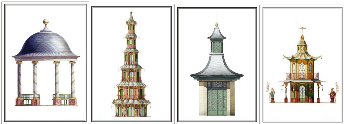
1670年特里亞農瓷宮其中四個青花瓷磚中式涼亭設計圖

但西洋歷史上有記載的第一座中國風建築的「瓷宮」，就是在凡爾賽宮 (Chateau de Versailles) 西北的「特里亞農瓷宮」(Trianon de Porcelaine)，此宮建於 1670 年，宮殿主體建築以各式瓷器裝飾，御花園有五個木結構的涼亭滿鑲青花瓷磚。原本用作路易十四 (Louis XIV 1638-1715) 的行宮和他的情婦蒙特斯龐侯爵夫人 (Madame de Montespan 1640-1707) 的住所。可惜此宮於 1687 年拆卸了，改建為巴洛克式的大特里亞農宮 (Grand Trianon)。雖然「瓷宮」至今已蕩然無存，但從流傳的建造圖則仍可見當日的精緻的影子。