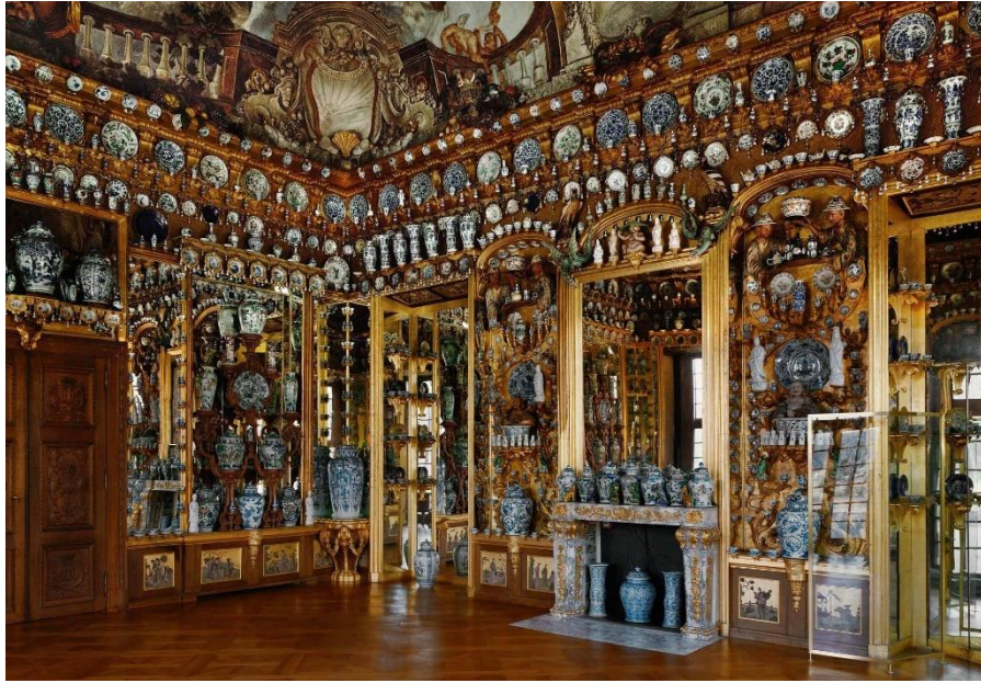
洛可可風格的德國柏林夏洛滕堡瓷宮