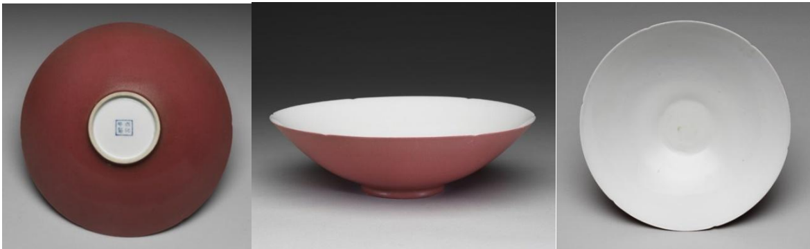
第九項胭脂紅彩淺碗「成化年製」款一件

上列第九項的「成化年製」款胭脂紅彩淺碗，瓷胎為一隻明朝永樂的白釉瓷碗，內有「永樂年製」暗款；康熙用此碗加胭脂紅彩於外壁，再入窯燒結。此碗現藏於台北故宮，藏品檔案編號 K1B000801N000000000，是一件蘊藏著永樂、成化、康熙三朝精魄的絕世瓷品。