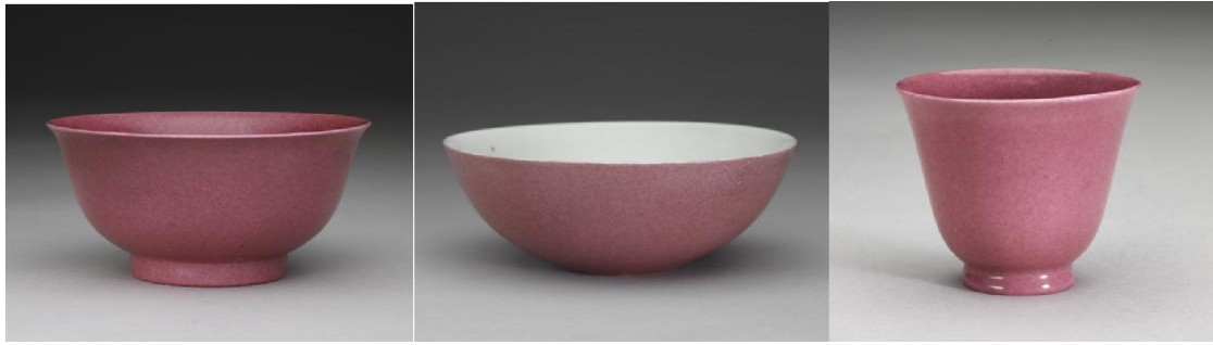
第六項胭脂紅彩碗十九件 (左) 第四項胭脂紅彩暗八寶淺碗五件 (中) 第二項胭脂紅彩鐘形杯七件 (右)