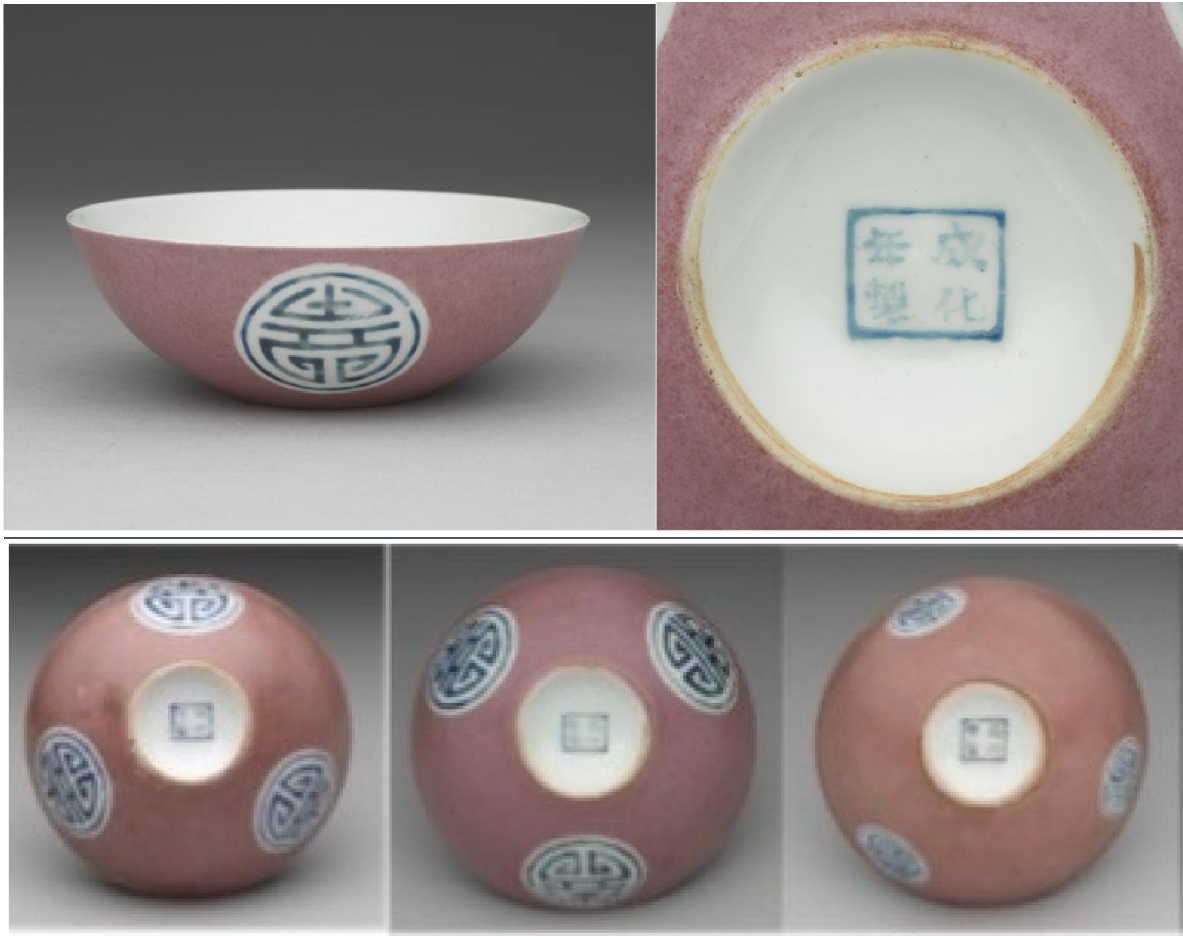
台北故宮藏表上第三項康熙胭脂紅暗八寶團壽紋成化年製款淺碗三件

當康熙作興想要燒造小件成化風格瓷器時，以御窯的人才、技術、設備，仿個八、九成根本不是問題，但因為順治開了這個自由發揮底款的先例，估計當時康熙亦是循舊例任由窯工自由發揮，以示只為遣興。