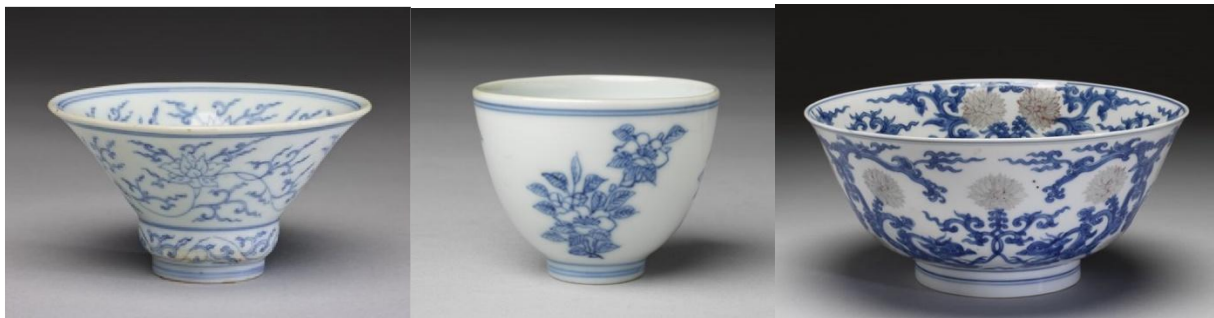
第八項青花纏枝蓮紋杯(左) 第七項青花折枝花卉紋杯(中) 第十一項青花釉裡紅菊花碗(右)

本來成化以鬥彩最超卓，但康熙的成化寄託款瓷，卻沒有鬥彩，也沒有應用成化的多彩鮮亮平塗繪畫工藝特色，而是以胭脂紅為主，可能此以金發色的紅釉，是康熙時期開發成熟的，所以最得他青睞。甚至連成化的薄胎，康熙也沒有刻意照顧，並沒有因為使用了二元配方，瓷泥的氧化鋁含量提高而坯體可以承受更高溫和變得更堅硬的優勢，把坯身做得更薄，而是保持本朝的風格。成化官窯器底款，眾所皆知並無「成化年製」四字款，但康熙御窯卻不刻意摒棄，而在既知事實的情況下，仍採用四字寄託款。所以更加肯定當時窯工並非奉旨仿製，而是真的是康熙寄情託興之作。