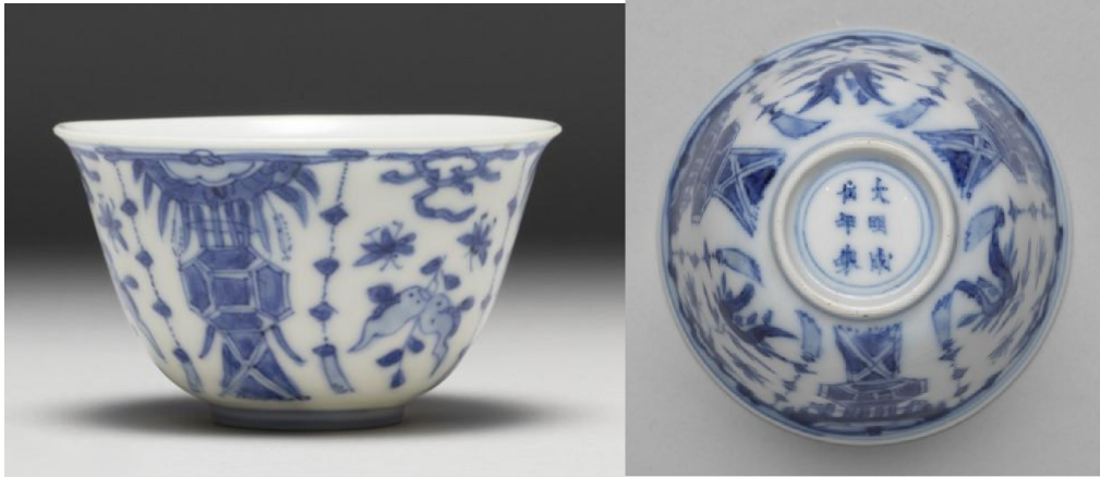
第十二項青花豐登杯共三件