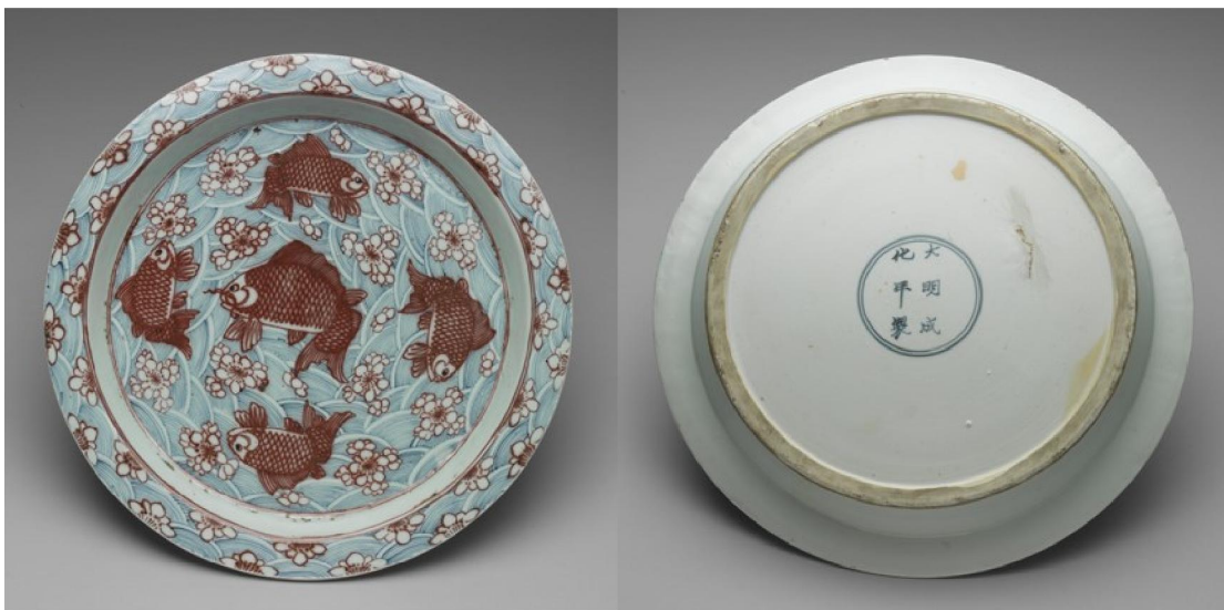
台北故宮藏順治青花釉裏紅成化款魚紋盤

清代官窯瓷器而落成化寄託款，傳世品看到的第一隻，是順治的青花釉裏紅魚紋折沿盤，盤面以釉裏紅繪五條游魚，成化沒有這樣的形制，雖然底款寫「大明成化年製」六字二行楷書款，但字體卻沒有刻意去臨摹成化的藏鋒童體書法，而似乎是任由窯工自由發揮。可知並不是順治要去仿成化，而是一件寄情託興作品，是清代官窯的第一隻落寄託款的標誌性瓷品。