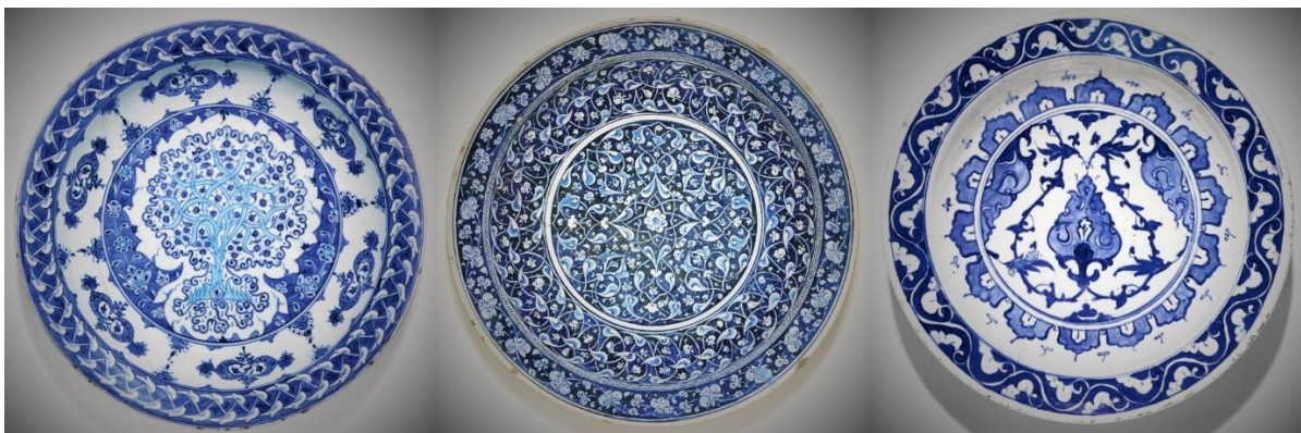
蘇富比 Iznik 青花大盤拍品三款，中間一件以 539 萬英鎊成交

到了 16 世紀中葉，伊茲尼克已發展到利用單色青花繪製了清爽淡雅但又繁縟複雜的紋飾，二者並行，自成一派的藝術陶瓷器皿，伊茲尼克陶瓷是 16 世紀以後歐洲瓷器收藏家與及博物館追捧的對象。歐洲蘇富比及佳士得每季都會舉行 Iznikware 專場，重要瓷品都以天價成交。