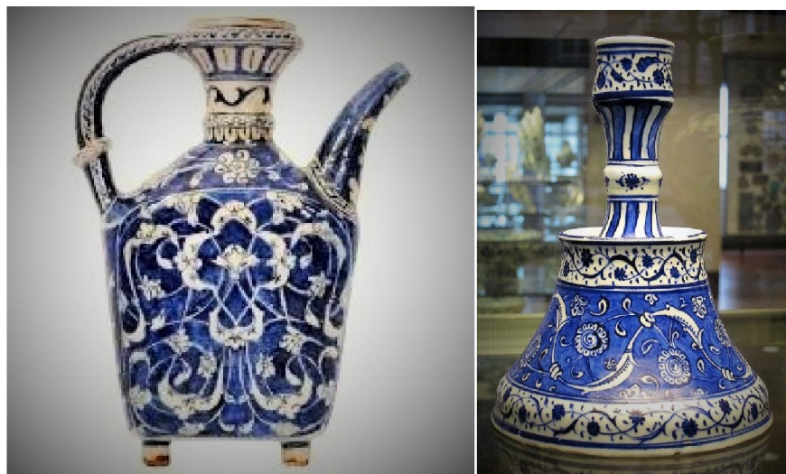
1510年製青花水壺 (左) 及1525年製燭台 (右)

但出乎大部份瓷友、學者的認知，原來奧圖曼帝國時期的土耳其，居然早於歐洲，在伊斯坦堡建了官窯，專門燒製青花。但此事要從當地民窯說起，事緣14世紀初土耳其奧斯曼帝國崛起，承傳其前身波斯塞爾柱帝國 (Seljuk Empire) 的傳統，也重視陶作藝術。遂把安納托力亞 (Anatolia)，就是小亞細亞，也是現代土耳其首都安歌拉 (Ankara) 一帶的一個行政市伊茲尼克 (Iznik) 培養成陶都。自15世紀末至17世紀末都未有間斷燒製手繪陶瓷。二百年間在此地燒製的青花陶和軟瓷，後世通稱之為「伊茲尼克器 - Iznikware」，是歐洲藏瓷的一個非常重要品種。