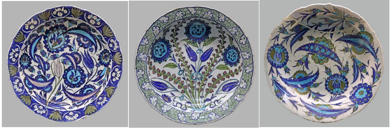
大英博物館藏 Iznikware 青花大盤三款