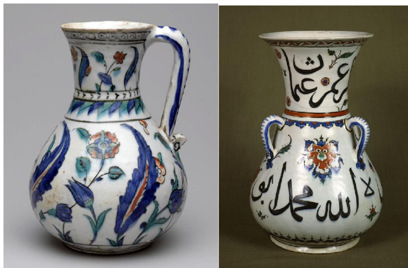
較後期之伊茲尼克五彩青花水注 (左) 及油燈 (右)

雖然伊茲尼克陶瓷業的蓬勃，與皇家的喜愛和支持分不開，但當時還不是由官方直接管理，其性質等同我國的貢窯或官搭民燒相近。真正的奧圖曼帝國官窯是在16世紀上半葉，蘇萊曼大帝 (Suleiman the Magnificent 1494-1566) 於1520年登基後，對伊茲尼克瓷器的需求增加，遂設窯在伊斯坦堡 (Istanbul)。當時除了主要生產瓷磚外，還生產釉下青花陶瓷器，如壺、吊燈、杯、碗和盤子等。