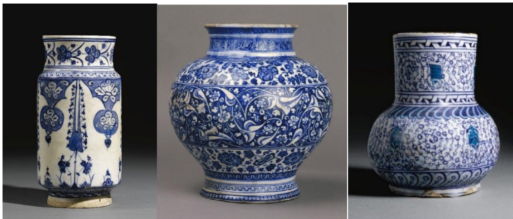
私人收藏16世紀初 Iznik 青花罐三款

我們口中的官窯，其實就是皇家製瓷工廠。中國明代的御器廠，於洪武二年(1370)正式成立。歐洲第一座官窯，是1710年在德國成立的「皇家瓷器廠」(Königliche Porzellan Manufaktur)，也就是在1830年正式改為「國家瓷器廠」的邁森。而第二座官窯，便是法國的「塞佛爾皇家瓷器廠」(Manufacture Royale de Sèvres)了。此窯現已把「皇家」二字改為「國家」(Manufacture Nationale de Sèvres)，歸法國文化部管理了。