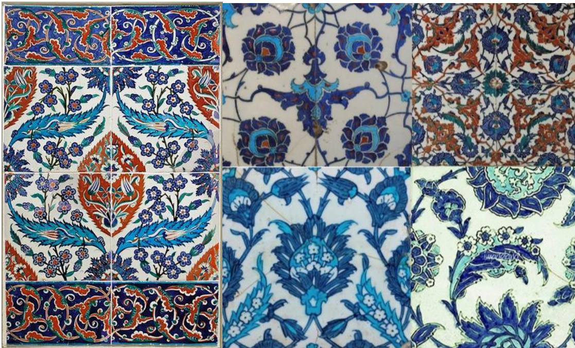
法國羅浮宮博物館藏伊茲尼克瓷磚組合 (左) 土耳其皇宮博物館藏四件彩繪磚 (右)

初期伊斯坦堡官窯製彩繪瓷磚，都使用釉上彩，但當水溶性彩釉融溶時，釉料互相交融沾染，無法成器，當時來自大不里士的磚匠遂採用在伊比利亞學到的方法燒製，就是以不溶於水的含碳酸錳 ( MnCO_3 ) 釉料，白描輪廓凸線於器面，然後在凸線內填彩，燒製時釉料被規範，便不流倘了，從而達到畫面乾淨的效果。這種類似我國琺華彩的乾線畫法，西班牙語就叫做「cuerda seca」。1550 年以後，乾線畫法已然淘汰，繪製瓷磚又回復應用釉下青花和綠松石彩了。1566年蘇萊曼大帝歿後，御窯解散，至此奧斯曼官窯便劃上句號。之後伊茲尼克市又恢復成為製陶和製磚中心。可惜到了17世紀初，不知何故，質量不比從前了。最後一個使用伊茲尼克市瓷磚的重要建築物，就是於 1616 年竣工的伊斯坦堡藍色清真寺 (Sultan Ahmed Mosque) 了。伊茲尼克陶瓷傳承兩百年後，於此遂成絕響。