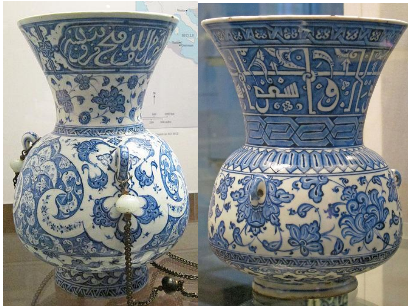
土耳其清真寺1510年製伊茲尼克青花吊油燈二款

尤其是奧斯曼蘇丹本身和近親伊朗波斯薩法維蘇丹 (Safavid) 都收藏了大量中國青花瓷，所以影響了土耳其奧斯曼陶器和波斯陶器的風格，也對後來伊茲尼克陶瓷器的發展產生了重大和強烈的影響。