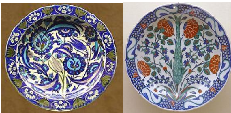
伊茲尼克 (Iznik) 釉下彩繪陶器二款

伊斯蘭地區對元、明青花瓷外銷是至為重要的市場，當時供穆斯林圍坐以手攝食的大盤繪有纏枝蓮紋，或稱卷草蔓藤花紋，是最有代表性的品種。而其他形制的青花瓷則大多取材於中東金屬製品，這種特殊的取向遂形成一個獨特的風格。但明代洪武時之海禁令嚴重阻礙了外銷貿易，而間接刺激伊斯蘭世界更刻意模仿中國風格的陶瓷器。今日參看中東幾個陶瓷生產國的傳世作品，有很大部份歐洲人基本上無法辨別是中國的還是中東的作品。