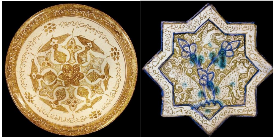
奧斯曼帝國陶藝作品二款

錫光釉是由西班牙開發傳入伊拉克的；而由伊拉克開發的彩釉，則反向傳入西班牙，再傳入義大利。西班牙的馬約卡島 (Majorca)，是伊比利亞 (Iberia) 彩陶輸往義大利和歐洲的轉運中心；馬約卡島以伊拉克彩釉發展出來的彩陶器和花磚，就叫做「馬約利卡」 (Majolica)。後來又影響了義大利磁磚、文藝復興時代的歐洲陶瓷磚、荷蘭的台夫特 (Delft) 磁磚、以及英國在1770年代工業革命之後的「維多利亞磁磚」 (Victorian Tiles) 的發展；此乃後話。