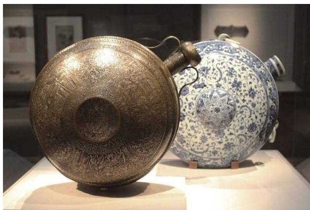
13世紀中葉伊拉克黃銅水壺 (左) 及 15世紀明代青花扁壺 (右)

伊斯蘭地區對元、明青花瓷外銷是至為重要的市場，當時供穆斯林圍坐以手攝食的大盤繪有纏枝蓮紋，或稱卷草蔓藤花紋，是最有代表性的品種。而其他形制的青花瓷則大多取材於中東金屬製品，這種特殊的取向遂形成一個獨特的風格。但明代洪武時之海禁令嚴重阻礙了外銷貿易，而間接刺激伊斯蘭世界更刻意模仿中國風格的陶瓷器。今日參看中東幾個陶瓷生產國的傳世作品，有很大部份歐洲人基本上無法辨別是中國的還是中東的作品。