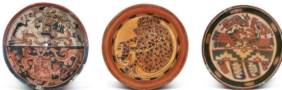
瑪雅彩繪動物圖案赤陶盤 - 蛇(左) 豹(中) 鷹(右)

令人奇怪的，反而是在大約公元三至十世紀的瑪雅「古典期」(Classic) 間，瑪雅已步入繁盛，從部落文化發展到城邦文化，互訪互市，但文明反而慢慢衰落，繼而發生內亂，戰爭、遷徙，最後甚至滅亡，科學發達卻一點幫不上忙。至今尚存者，只有瑪雅遺跡、語言、信仰，和各地瑪雅人至今仍沿用的瑪雅曆；等同全球華人至今仍沿用夏朝創製的農曆一樣，二者有一定程度的相同習性。