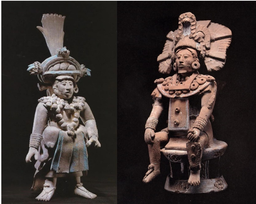
赤陶瑪雅盛裝戴羽飾珠寶君主男俑二款

盛世藝術通常都由王室帶動，藝術和精英階層關係密切，古今中外皆然。此點亦反映在瑪雅藝術品上。因為赤陶的可塑性高，成形工藝技術要求又低，考古出土的各類瑪雅藝術品中，赤陶器是工藝最成熟、動感最強的藝術品類別。而瑪雅赤陶藝術品，從傳世品看，有兩個大類，其一是以戰士形象為主的陶俑，其二是人物故事為主的彩繪直筒形水器。