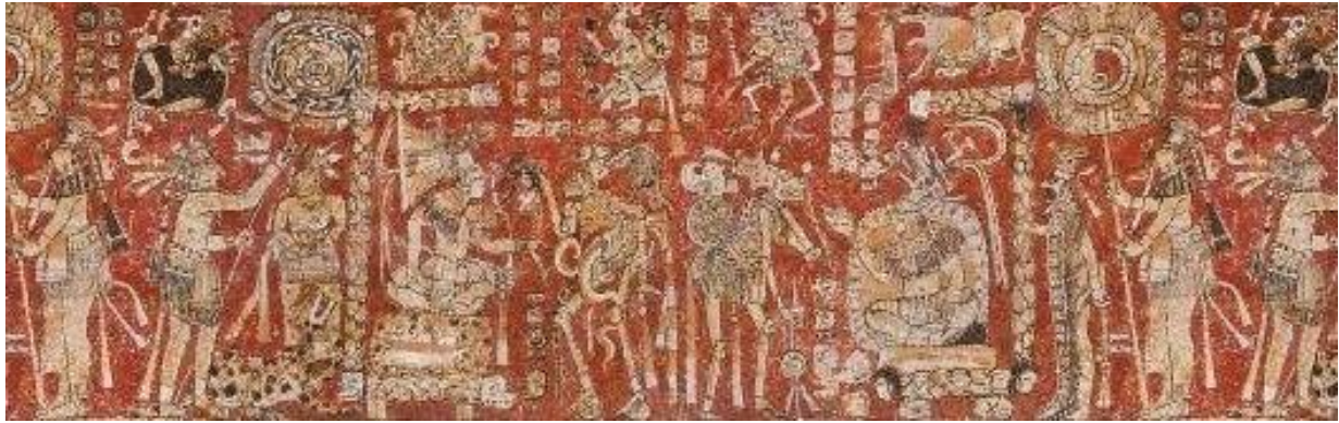
瑪雅赤陶筒形瓶彩繪死神巡遊圖