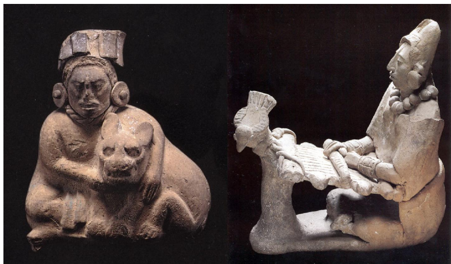
養美洲豹作寵物的貴族男俑 (左) 織布的貴族女俑 (右)

令我讚嘆不已的，是瑪雅赤陶品的藝術形態和視覺藝術的表現，但這不表示瑪雅赤陶藝術凌駕於其它國家已發現的赤陶藝術品之上；例如公元前246-208年中國的兵馬俑、公元前十三至十六世紀的埃及十八王朝的神像，和公元前二世紀的希臘坦拿加地區陶俑等，都可互相媲美。從生活必需品和工藝品的製作技術層面而言，瑪雅文明的工藝技術，基本是處於新石器時代和銅石時代 (Chalcolithic 或 Copper Age) 的水平，個人絕對無法想像部落文化會與高深的天文、曆法、建築、數學等科學掛勾。