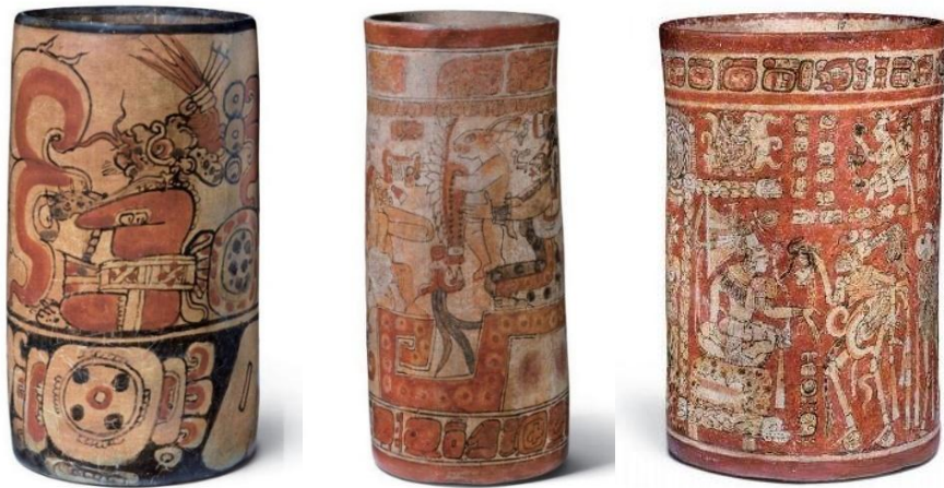
瑪雅彩繪神祇赤陶直筒形水器 - 太陽神 (左) 月神 (中) 死神 (右)

瑪雅人對繪畫紋飾的重視，甚至超越器皿本身，繪畫筆觸細膩，有以毛筆描繪的效果，而恰恰瑪雅人當時已懂得用獸毛製成毛筆應用在書寫和繪畫了。從考古遺址或墓葬出土，亦發現有書寫工具、顏料罐、調色盤與及研磨顏料的杵臼；亦發現有書吏 (scribes) 的赤陶人俑和浮雕。因為瑪雅平民並不識字，書吏是精英階層出身有學問的「寫字繪畫人」。