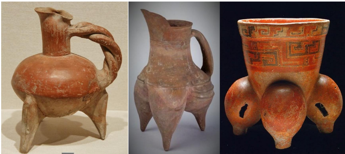
大汶口文化紅陶繩把鬶(左)、龍山文化紅陶鬶(中)、瑪雅赤陶三足杯(右)

盜友都知道我心儀少數民族織物及陶器，例如前些時談過的「滿者伯夷」赤陶器就是一例。瑪雅人製作陶器時使用盤泥、泥板和手掐成形，之後在戶外露天處以火炭、草、木明火燒製，其法與燒製兵馬俑和「滿者伯夷」赤陶器大致相同。國際上稱不用轆轤，純以手工製作的赤陶器為「Terracotta」。瑪雅陶器亦可納入此類。