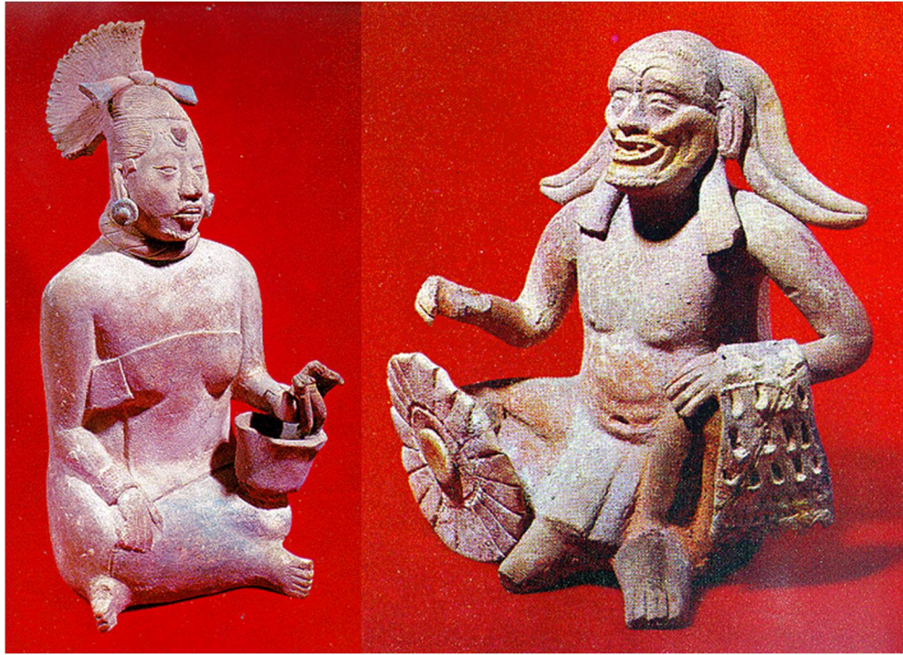
瑪雅書吏陶俑有類似書寫工具 (左) 有厚棉軟甲及盾牌的瑪雅戰士

瑪雅人對繪畫紋飾的重視，甚至超越器皿本身，繪畫筆觸細膩，有以毛筆描繪的效果，而恰恰瑪雅人當時已懂得用獸毛製成毛筆應用在書寫和繪畫了。從考古遺址或墓葬出土，亦發現有書寫工具、顏料罐、調色盤與及研磨顏料的杵臼；亦發現有書吏 (scribes) 的赤陶人俑和浮雕。因為瑪雅平民並不識字，書吏是精英階層出身有學問的「寫字繪畫人」。