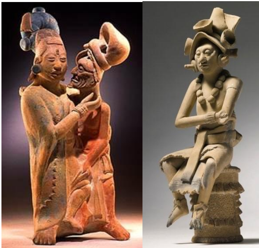
赤陶瑪雅戴頭飾貴族俑三款

略有不同者為瑪雅的赤陶成份和龍山、大汶口、馬家窯等略有不同，因為瑪雅地區周圍的土地都是石灰岩，所以赤陶土含有大量方解石 (calcite) 成份，方解石就是碳酸鈣 ( \text{CaCO}_3 )，有定形的功能。而瑪雅人在製陶坯時用草木灰和細沙與土混合，此配方有強化坯體的功能。