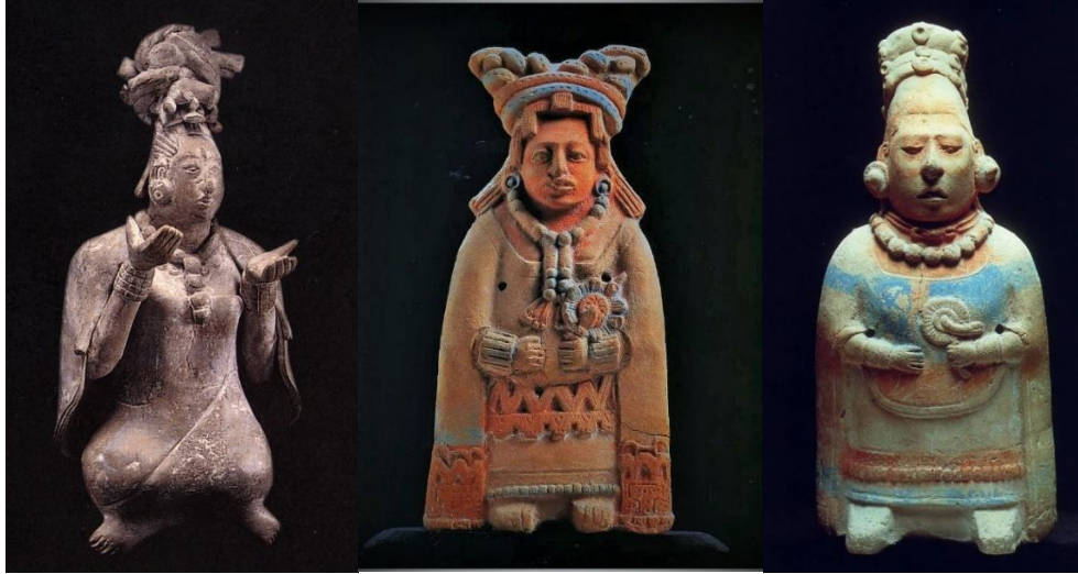
赤陶瑪雅貴族女俑三款

雖然在瑪雅歷史上亦有女兵，但並非主力，所以以戰士形態出現的女陶俑未見。但因為瑪雅最早是母系社會，女性的地位較高，所見女性陶俑皆衣飾華麗，應是貴族，而衣飾大都有染彩，更形華麗。瑪雅彩陶上，動物也常會出現，尤其是美洲豹，陶器圖形常以之來表示力量和強悍。