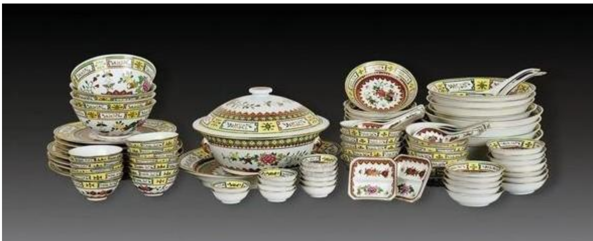
景德鎮 60年代 97 頭粉彩中式餐具