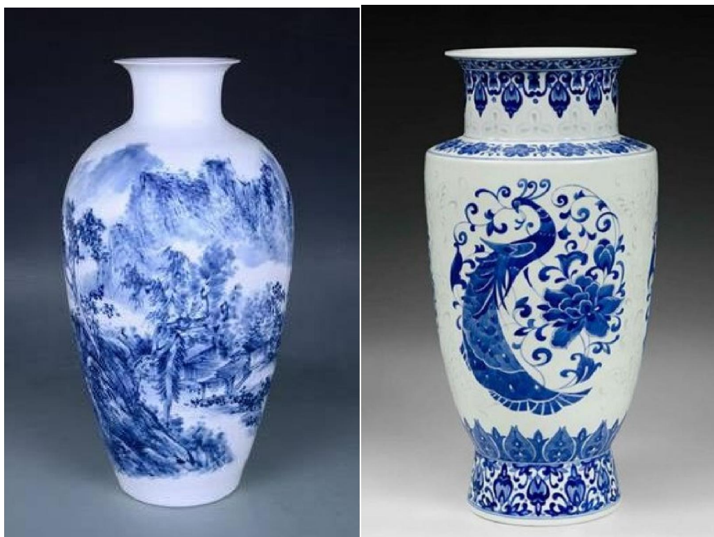
70-80年代景德鎮青花 200 件花瓶二款

但實際上在景德鎮瓷器行業而言，「件」不是量度單位，並沒有固定的尺寸大小，而是一個很模糊的概念性體積單位。當然「件」數大的，有可能相對較高，但「件」之大、小，卻是以體衡量的。例如一件高40公分，腹徑15公分的瓷瓶，行家稱為150「件」；而一件較高但腹徑較少的，例如高50cm、腹徑10cm的，也叫150件。但如果是高50cm、腹徑15cm的，便會是200「件」了。的確是有一點概念性。