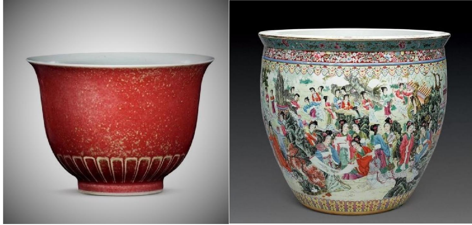
景德鎮 60 年代美人醉金鐘碗 (左) 70 年代粉彩百美圖大魚缸 (右)

雖然上文說瓷友自我釐定「件」的標準不準確，但既然「件」是概念，而信念中琢器甚少異形，既然沒有固定的量度標準，那麼姑且按慣例提供一個概念性的指引，其實也不為過。瓷友以為然否？