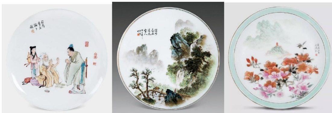
景德鎮 70 年代粉彩盤人物盤 (左) 70 年代粉彩山水盤 (中) 80 年代粉彩花卉山水盤 (右)

須知道此所謂「件」，並不是平常口語中代表「個」、「隻」的「piece」，亦不是通用的多少「頭」。口語中的多少「頭」很容易理解，例如購買「十頭」鮑魚，即一斤有十隻之意。同理，一套60隻各種不同形制的瓷器餐具，也叫「60頭」；但「件」卻是景德鎮獨有的瓷器大、小的規格稱謂。