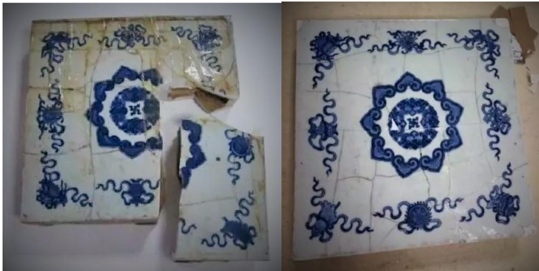
青花八寶萬福如意瓷磚兩件

故宮的太和、中和、保和三大殿與及養心殿等的牆壁均是中空的，殿內青磚地台下砌有縱橫相通的火道，直通向殿外的火爐。當點燃薪炭時，熱氣會順著管道擴散到地面與牆壁各處。今日在故宮所見排煙口都設在戶外，出口用鏤空的磚雕掩蓋。