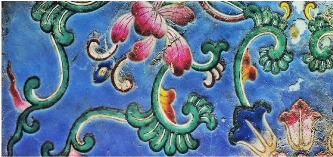
圓明園粉彩地磚殘片之一