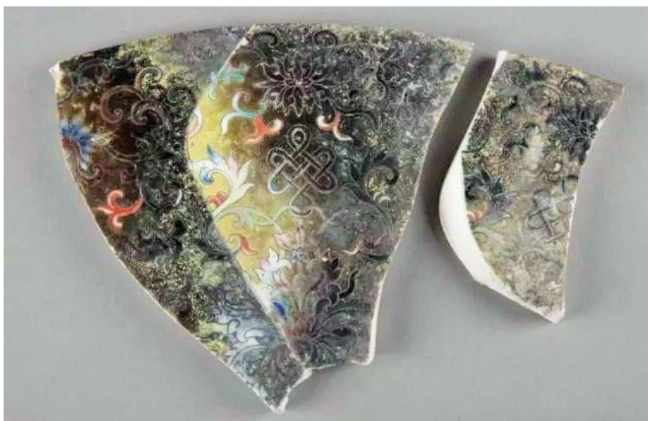
圓明園粉彩如意紋地磚殘片三片

參與考古的專家感嘆「皇家奢侈到連地磚都用這麼精美的粉彩。」但我卻認為若不是因為皇家奢侈，怎會留給後世無數的奇珍異寶和文化遺產？我的疑問反而是究竟當時實際上是如何保養這些地磚？如有因為踐踏過度或年久而致磨損、退色、崩裂等的修復、保養、更換等，與及相關的設計、製作、庫存等等有關「粉彩瓷磚」的甚至雞毛蒜皮小事，我都有興趣知道。