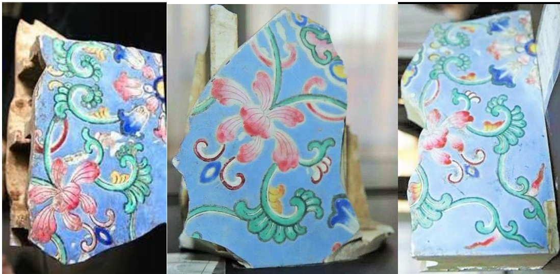
圓明園粉彩地磚殘片三片

但圓明園鋪設和燒造「粉彩瓷磚」一事，我卻沒有在《清檔》和有關御窯廠的文獻讀過，也許是我個人的疏忽，瓷友若有讀過任何有關的文獻，請不吝賜教和分享，解我蒙昧。