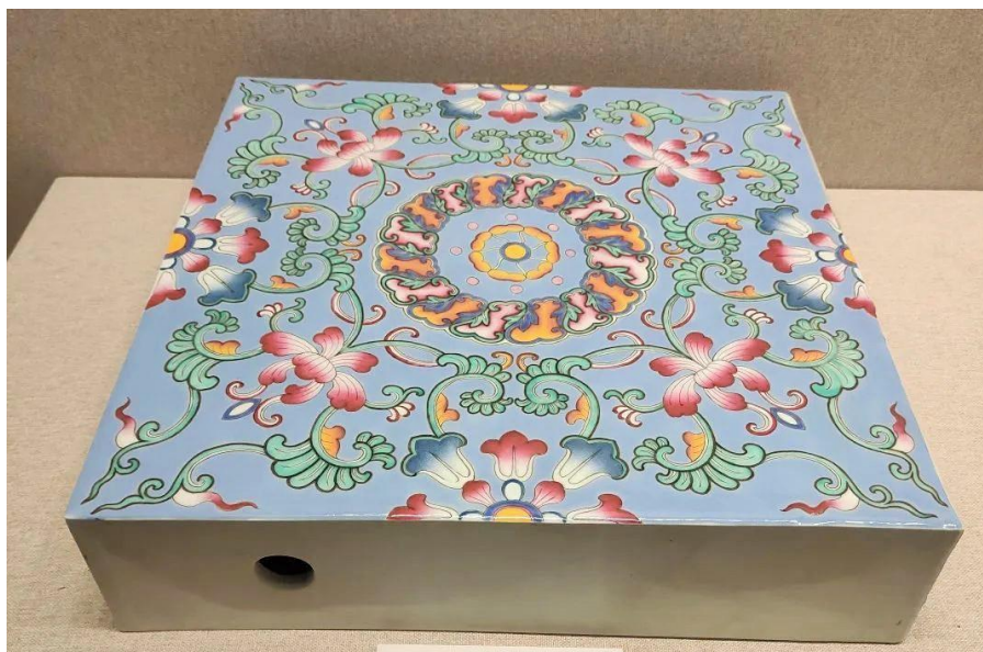
完整的圓明園遺址粉彩瓷磚

參與考古的專家感嘆「皇家奢侈到連地磚都用這麼精美的粉彩。」但我卻認為若不是因為皇家奢侈，怎會留給後世無數的奇珍異寶和文化遺產？我的疑問反而是究竟當時實際上是如何保養這些地磚？如有因為踐踏過度或年久而致磨損、退色、崩裂等的修復、保養、更換等，與及相關的設計、製作、庫存等等有關「粉彩瓷磚」的甚至雞毛蒜皮小事，我都有興趣知道。