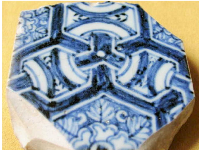
青花龜甲紋瓷磚殘件

紫禁城內嚴冬使用的「火牆」和「地暖」系統，自明代就有了。晚明太監劉若愚在《酌中志》中有載：「乾清宮大殿 (中略) 右向東曰懋勤殿，先帝創造地炕於此，恒臨御之」由此可證。但其實早於秦代時，就有利用陶製的筒瓦相扣，形成類似火炕與火牆的結構了。