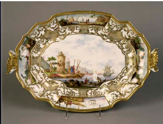
邁森 1735 年琺瑯彩托盤