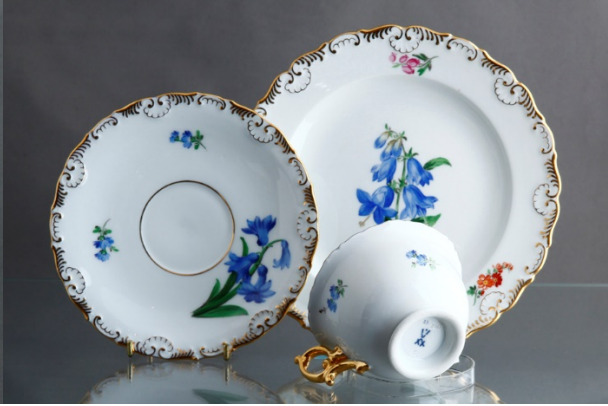
邁森 1924 年三件一套茶具