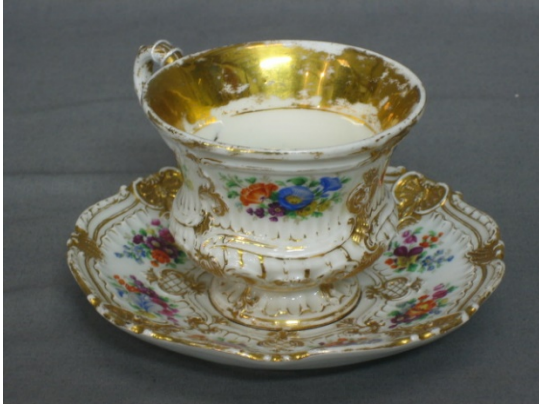
邁森 19 世紀手繪杯碟一套