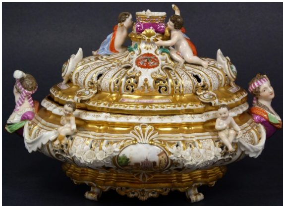
邁森 19 世紀手繪首飾蓋盒