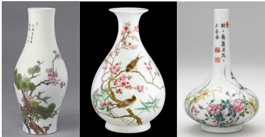
乾隆琺瑯彩詩文瓶三款

施德之，即斯特之 (E.A.Strehlnee)，拉脫維亞 (Latvia) 人，原俄國軍人，1904年於日、俄戰爭期間駐守哈爾濱，退役後到上海做藥品生意，以生產治小兒治中暑腹瀉的「十滴水」著名，這是外國人在上海開設的第一家藥廠；聞說此1953年後併入上海第四製藥廠。我兒時有用過的治肚痛腹瀉藥「施德之濟眾水」應該是他家的出品吧，施德之民國時的總發行所就在民國時期上海泥城外跑馬場對面。民國36年時總發行所在南京東東路，藥廠在中正西路。此藥今日在中、港、台仍有售，是否其後人經營則待考了。