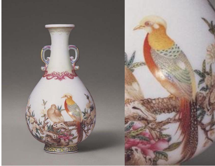
乾隆琺瑯彩題詩花石錦雞圖雙耳瓶

其一為「清乾隆琺瑯彩題詩花石錦雞圖雙耳瓶」，是國內透過香港古董中介於2005年10月23日秋拍時以1.15億港元投得此瓶，現存中國國家博物館。其二為2018年10月3日秋拍以1.7億港幣成交的「清乾隆御製琺瑯彩虞美人題詩盃」。