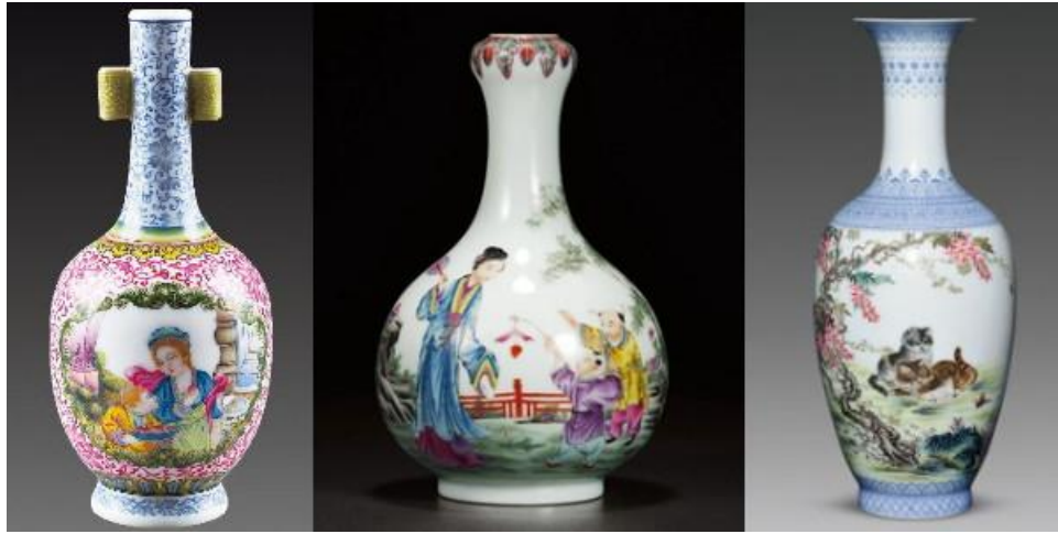
民國仿乾隆琺瑯彩貫耳瓶 (左) 蒜頭瓶 (中) 及詩文瓶 (右)