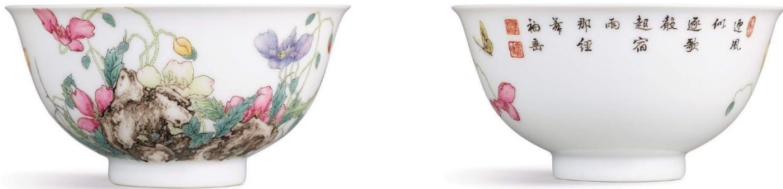
靴乾隆琺瑯彩虞美人題詩盃

其一為「清乾隆琺瑯彩題詩花石錦雞圖雙耳瓶」，是國內透過香港古董中介於2005年10月23日秋拍時以1.15億港元投得此瓶，現存中國國家博物館。其二為2018年10月3日秋拍以1.7億港幣成交的「清乾隆御製琺瑯彩虞美人題詩盃」。