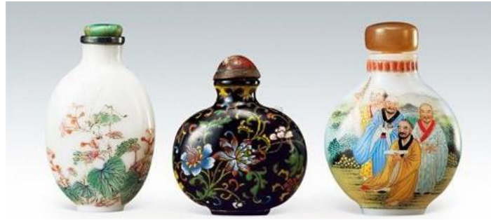
古月軒琺瑯彩鼻煙壺三款