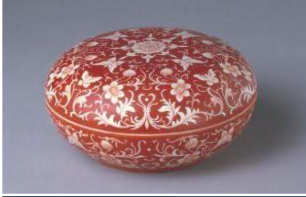
北京故宮藏雍正抹紅蝶戀花蓋盒