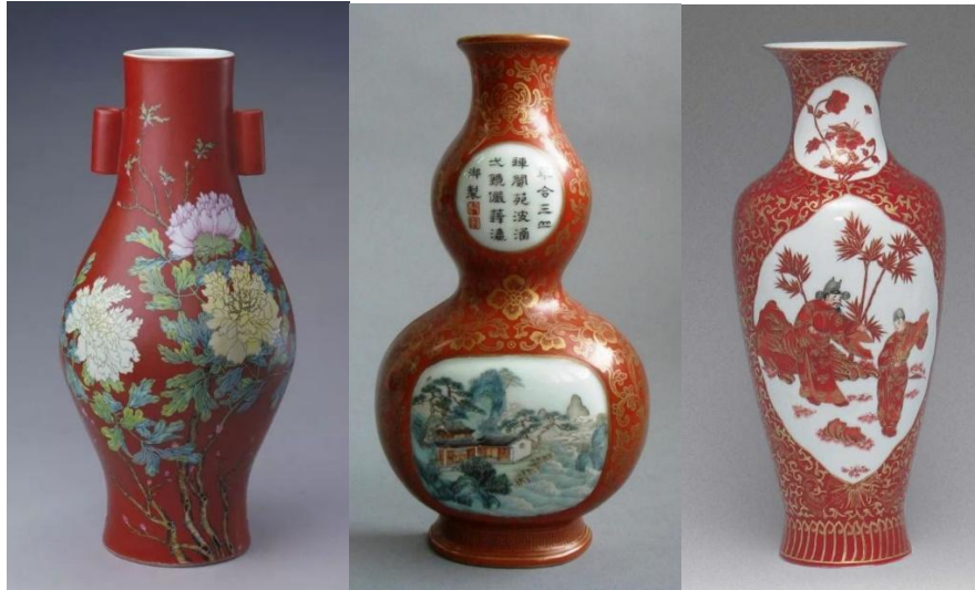
礬紅抹紅雍正牡丹紋貫耳瓶(左) 乾隆葫蘆瓶(中) 民國觀音瓶(右)

按清藍浦《景德鎮陶錄》所載，景德鎮礬紅釉配方為「用青礬煉紅加鉛粉、廣膠合成。」所謂煉紅，即煅燒分解，故稱「礬紅」，又叫「生紅」。當時是以14%生紅和86%鉛粉作助熔劑配製而成。礬紅釉最大特點是呈色穩定，燒成溫度一般為 900℃左右；若溫度過高或燒成時間過長，則會使部分氧化鐵滲入胎、釉之中，使紅釉的色調閃黃。