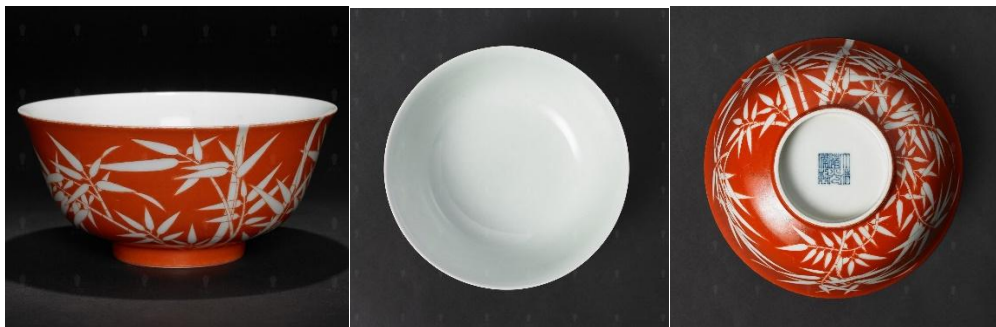
道光礬紅抹紅留白竹葉紋碗

「抹紅」是施礬紅釉工藝之一種，始於明代，於清康熙時期發展最為成熟，迄晚清、民國，抹紅瓷器更為普遍。礬紅器主要之施釉工藝，有「描紅」、「抹紅」、「吹紅」三大類。顧名思義，「描紅」就是以細筆點線寫畫，多用於需精描細繪的瓷品。「吹紅」就是「吹釉」，以細紗蒙竹管蘸釉漿，以口吹釉於坯面，形成一層厚度均勻的釉，多用於滿地單色釉的瓷品。而所謂「抹紅」，其實即是「抹釉」，或「刷釉」技法。多用於需保留局部有色釉面，又需留空間繪畫或寫詩文的瓷品，雖然大幅著色處釉層不均勻，但需結合「吹紅」與「描紅」技法的瓷器，又的確要使用「抹紅」法才能完成的。