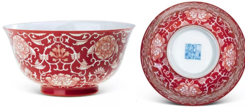
北京故宮藏乾隆抹紅纏枝蓮紋碗

兩位瓷家的文字帶給後學瓷友對紅色無限的感悟遐思和想像。當然其中「萍果青」和「萍果綠」，瓷友都知道是銅紅釉氧化之異變，但仍屬紅釉色域範疇。唯「抹紅」、「礬紅」、「翻紅」三個名稱，作為色域名稱，筆者卻不敢苟同，因為都屬於色釉工藝。