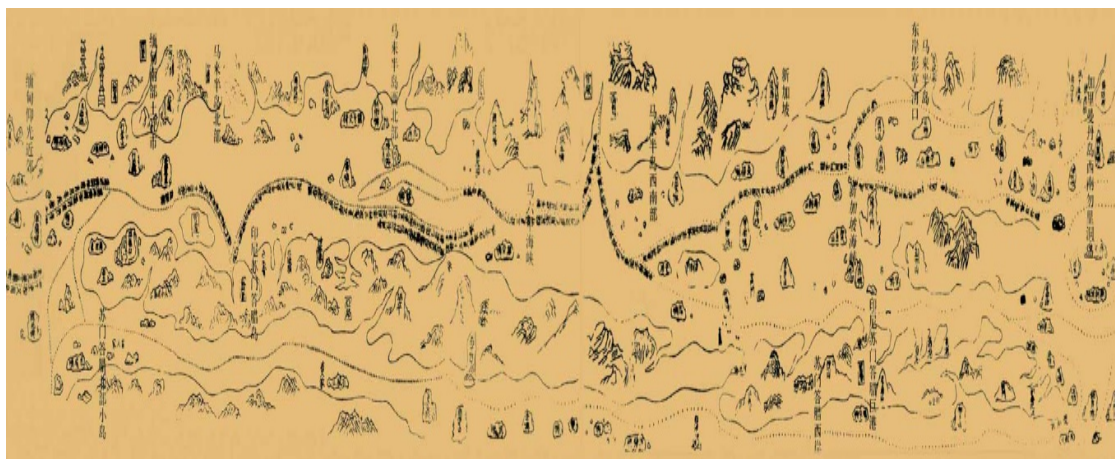
鄭和下西洋航海圖