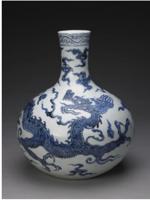
北京故宫博物院藏品