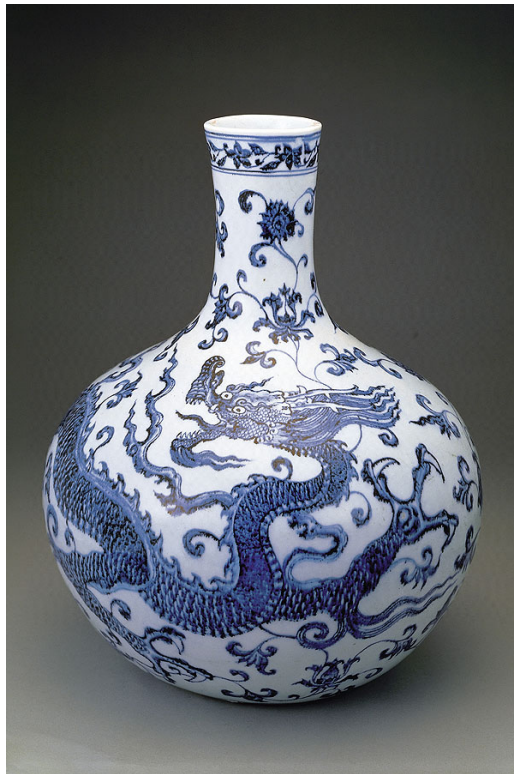
台北故宮博物院藏品