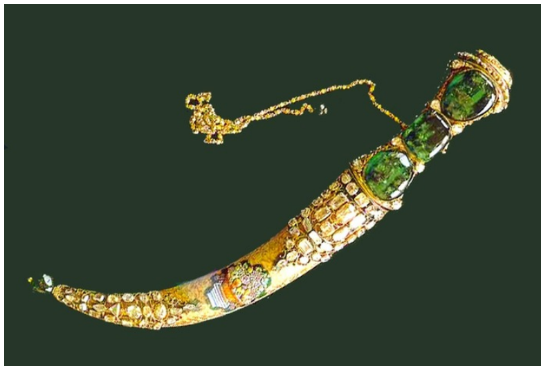
托普卡比皇宮博物館的綠寶石匕首

至於瓶身繪龍紋，則以雙勾填色，龍身較胖，肥爪，帶披髮，威武凶猛，與 宣德 龍類同；蘇麻離青料之氧化鐵光遍佈龍鱗，渾然天成，有意想不到之立體效果。 明初 洪武 、 永樂 官窯之龍紋，承襲元制，除造型改變得更威武外，亦為三趾；而至 宣德 以後，始三、五趾並用。天球瓶體形碩大而厚重，分段接合，燒製較難，時會發生塌窯變形。青花天球瓶始於永、宣，有明一代，亦只見於永、宣。現今市場一出現，必為藏家重金收入囊中的對象；可幸大眾瓷友，仍可於京、台故宮及海外多處博物館細細欣賞。