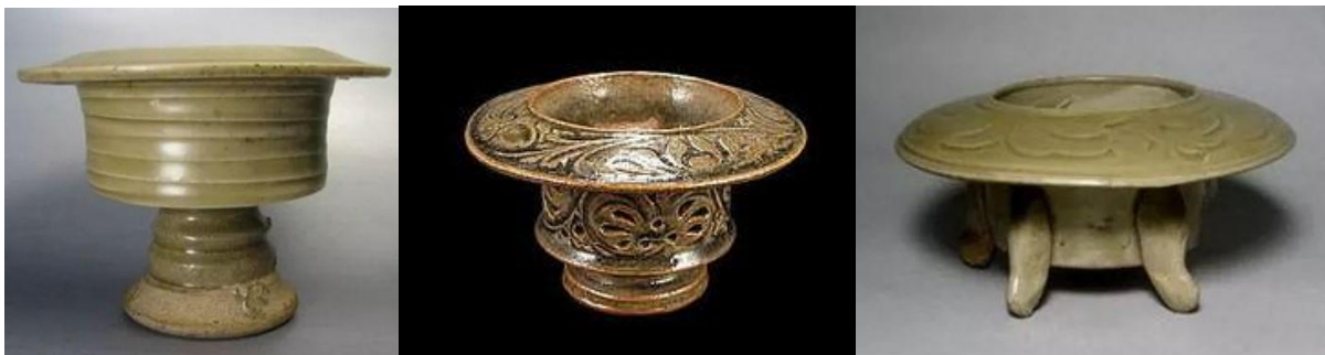
宋代耀州窯行爐三款

從美國俄亥俄州的克利夫蘭藝術博物館 (The Cleveland Museum of Art) 藏的宋代趙光輔絹本設色《番王禮佛圖》，描繪少數民族番王朝拜佛像的故事。其中有一人手捧一隻圓形寬平口沿的器物，而這就是已改進了了的陶瓷行爐了。