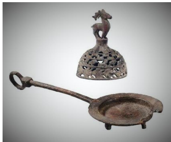
犍陀羅出土之鹿頂銅製鵲尾爐

我們在觀摩實物時，發現燒製口沿時，工藝相對簡單。因寬口沿是另外以圓規在泥板劃出，陰乾利胚後黏在高足杯之上便了。一般我們黏合配件，多用濕泥漿塗於黏合處，乾後燒結便牢不可分。但量產行爐的口沿，不用泥漿，只把口沿架於杯口便上釉，利用釉的黏稠性互相黏結，然後燒結；所以存世行爐，有相當的一部份，是黏、燒不穩，以致杯、沿分離的。