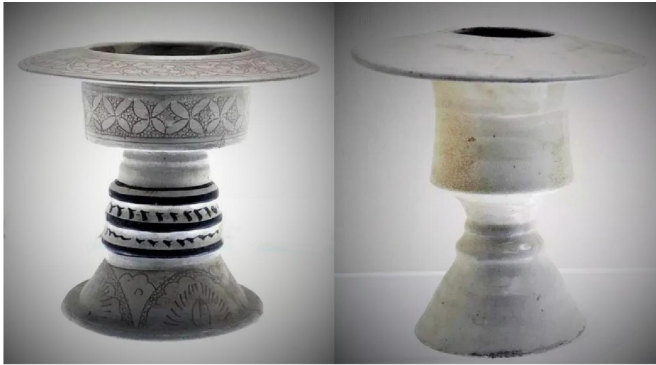
邯鄲市博物館藏北宋白釉行爐二款

原來自南北朝始，佛教中有一種修持，叫做「行香」，即手捧香爐沿佛像繞行，是禮佛儀式的一種。因用此器作香爐，所以設計上，要有放香的斗，因以手持行，故採用了防燙手的高足，在不手持時又可固定放置桌面，所以又必要有座台。遷就各種功能的綜合造型，便有了和高足杯相近的形製。因為此爐是走著使用的，故稱之為「行爐」。