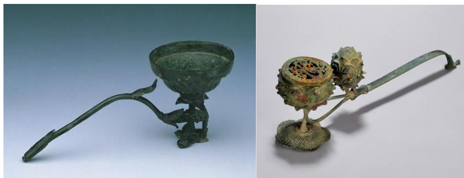
台北故宮藏宋代(左)及遼代(右)鵲尾爐

傳入之後，便進入改進階段，衍化出各種大小，各種裝飾，各種造型的鵲尾爐，我們從山西雲崗石窟、敦煌莫高窟的唐代壁畫，便可看到當時的鵲尾爐形制。