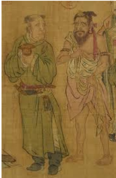
宋趙光輔《番王禮佛圖》中之手捧行爐

銅製香爐，加了鵝尾，持之不使燙手，迄隋、唐、宋期間，隨著陶瓷業的興起，便流行使用陶瓷器皿，陶瓷加鵝尾，不單累贅，成本又增加，改進為手持高足，亦有不燙手功能。所以當時成為流行式樣，南北各窯口均有燒造。其中又以專門燒造民用生活品的耀州窯生產最大宗。此昔日只有王公貴族使用的器皿，也普及到了民間，自此貴族、平民無差異禮佛。