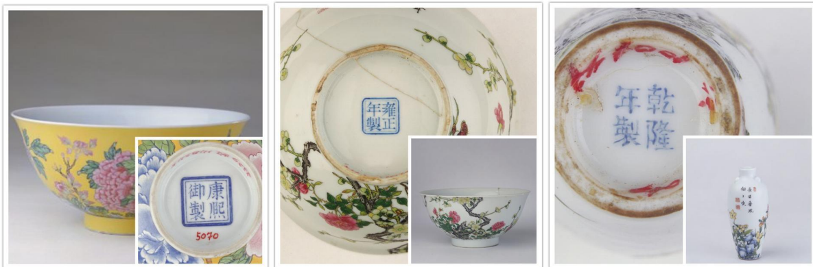
北京故宮藏康熙(左) 雍正(中) 及乾隆(右) 琺瑯彩及底款

這批琺瑯彩其實於乾隆三年九月開始陸續配置木座及楠木匣。後來連同康熙及乾隆燒製的琺瑯彩四百多件，全部藏於北京故宮乾清宮東端凝殿北。道光十五年七月一日全部入冊，就是《乾清宮琺瑯玻璃宜興磁胎陳設檔》，內中詳細記錄了宮中藏康雍乾三朝琺瑯彩的品名和數量，自此沒有流失半件。