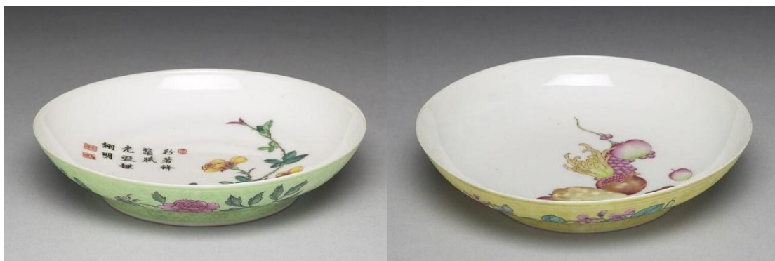
乾隆磁胎畫琺瑯花果碟二款

民國四十年以後，掌握琺瑯彩工藝技術的畫工窯工老成凋謝有者，因戰亂無生計有者，琺瑯彩仿製基本上停頓了。俟新中國成立以後，五十、六十、七十年代，仿古瓷由國營瓷廠接手作為創匯工具，仿製大量古瓷，此時期的出品，藏界稱之為「五六七瓷」，唯其中罕見有仿琺瑯彩。直至上個世紀九十年代中期，中國拍賣行業興盛，高價琺瑯彩瓷市場需求大增，帶動景德鎮的高仿古瓷業亦隨之興盛。