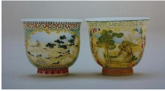
乾隆料胎畫琺瑯酒杯一對