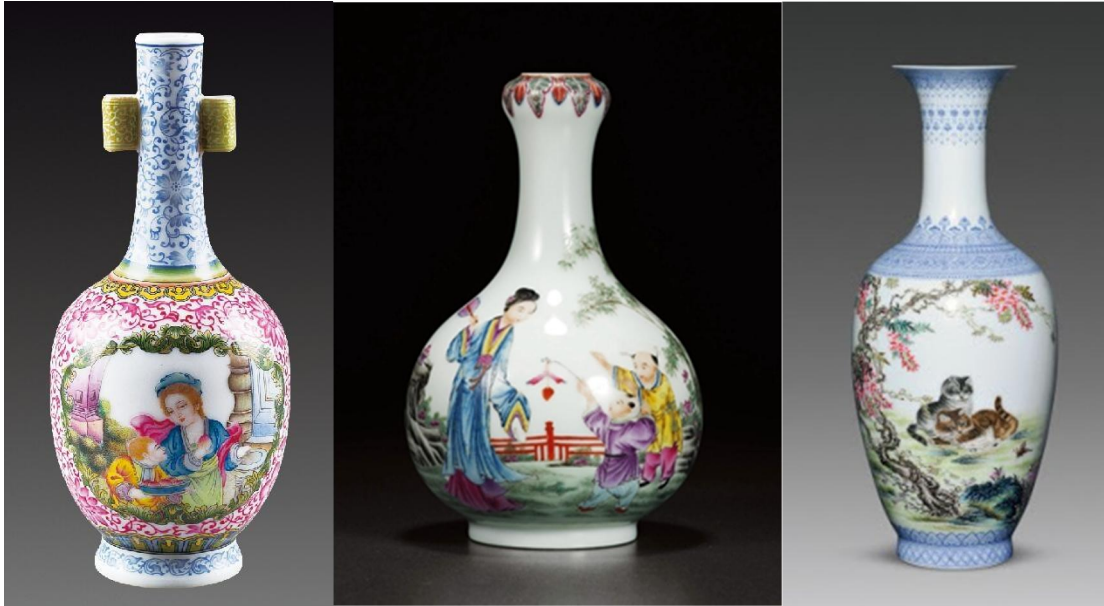
民國仿琺瑯彩貫耳瓶 (左) 蒜頭瓶 (中) 及詩文瓶 (右)

民國四十年以後，掌握琺瑯彩工藝技術的畫工窯工老成凋謝有者，因戰亂無生計有者，琺瑯彩仿製基本上停頓了。俟新中國成立以後，五十、六十、七十年代，仿古瓷由國營瓷廠接手作為創匯工具，仿製大量古瓷，此時期的出品，藏界稱之為「五六七瓷」，唯其中罕見有仿琺瑯彩。直至上個世紀九十年代中期，中國拍賣行業興盛，高價琺瑯彩瓷市場需求大增，帶動景德鎮的高仿古瓷業亦隨之興盛。