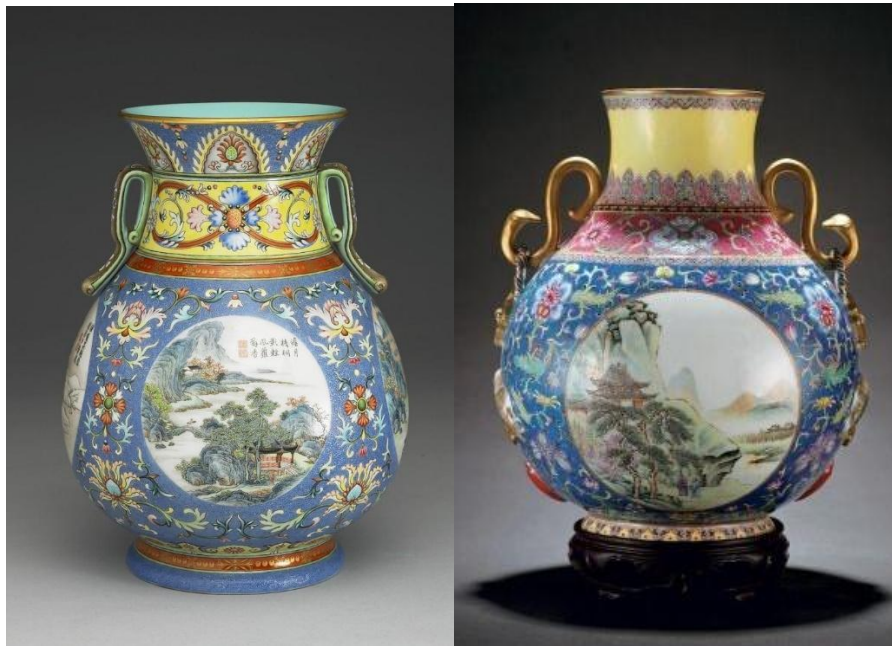
台北故宮藏乾隆磁胎洋彩翠地山水詩意雙喜罇 (左) 及民國1947年仿品

民國初年的仿品，當以故宮實物為藍本，以舊胎描新彩，仿製清宮琺瑯彩為先，這些後掛彩仿品，均為北京幾家細瓷店之傑作，繪畫細緻，風格一致，毫無破綻，離分真偽。聞故宮博物館也購有十餘件精緻的民國仿品作為教材之用。現在拍場上有幾件天價拍品，江湖傳聞說是後掛彩，但策略性的商業行為，兩相情願，屬於他人商業決定，亦不必深究。