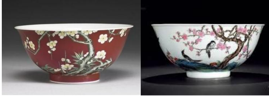
台北故宮藏雍正法琺瑯彩碗 (左) 及民國仿品 (右)

民國初年的仿品，當以故宮實物為藍本，以舊胎描新彩，仿製清宮琺瑯彩為先，這些後掛彩仿品，均為北京幾家細瓷店之傑作，繪畫細緻，風格一致，毫無破綻，離分真偽。聞故宮博物館也購有十餘件精緻的民國仿品作為教材之用。現在拍場上有幾件天價拍品，江湖傳聞說是後掛彩，但策略性的商業行為，兩相情願，屬於他人商業決定，亦不必深究。