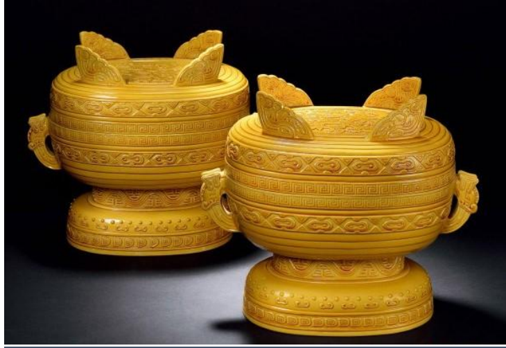
乾隆黃釉饕餮紋簋

明代黃釉乃是含氧化錒與氧化鐵呈色劑的覆釉器，即是先燒製白瓷素胎，再澆黃釉。康熙時黃釉瓷多仿明宣德和弘治，仍以二次複燒的覆釉器為主。雍正時期以粉彩用的氧化錫加進黃釉，呈色潔亮。當時之所謂「仿澆黃器皿」及「西洋黃色器皿」即此。其實「仿澆黃器皿」即是以氧化鐵呈色，而「西洋黃色器皿」則是屬氧化錒黃釉。