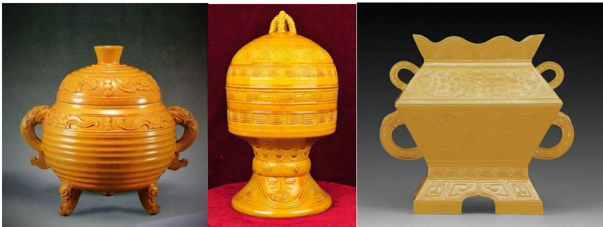
光緒黃釉三足獸耳簠(左) 黃釉圓形豆 (中) 黃釉簠(右)

所有瓷祭器的圖樣，均源自乾隆十四年 (1749) 由梁詩正等奉敕纂修，於乾隆二十年成書的《欽定西清古鑑》四十卷。此書將清宮庋藏的鼎、尊、彝等青銅器一千五百二十多件，分門別類，薈輯成書，每器一圖，並加文字闡說。祭祀禮器主要有爵、登、簠、豆、犧尊、銅、簠、簠、簠、俎等。藍釉、黃釉，紅釉、白釉四種單色釉禮器之式樣即出於此書。