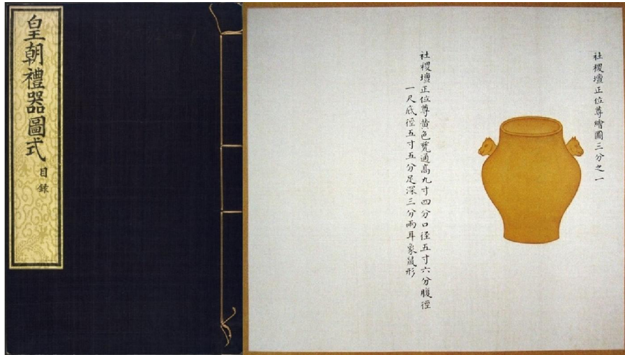
乾隆《皇朝禮器圖式》社稷壇祭器之黃瓷尊

清宮亦保留明代四壇祭祀習慣，以瓷器代替青銅器，將色釉祭器應用在天、地、日、月四壇祭祀上。所使用的祭器，亦循《大明會典》所載：「洪武九年定，四郊各陵瓷器，圜丘青色，方丘黃色，日壇赤色，月壇白色」，所以黃釉器除了皇家自用外，亦用於祭地。