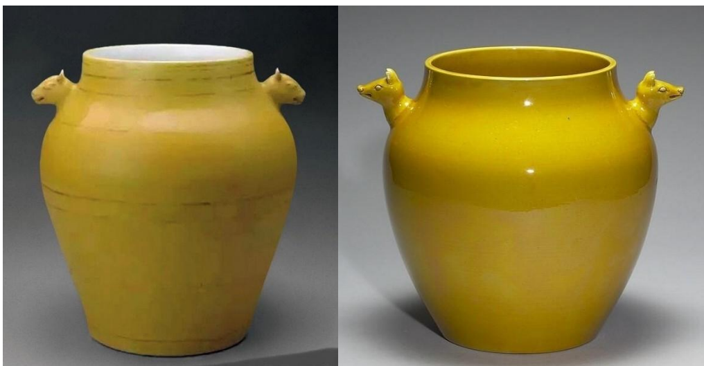
南京博物館藏明弘治 (左) 及 台北故宮藏乾隆 (右) 黃釉犧耳尊

清宮使用黃釉器，規定極為嚴謹，清承明制，不同身份使用不同釉色、紋飾的瓷器，不得逾越。例如皇帝、皇后和皇太后用明黃色；皇貴妃用外黃內白色；貴妃和妃用黃地綠龍色；嬪妃用藍地黃龍色；貴人、常在、答應與及其他皇親國戚一概不得使用帶黃色的瓷器。