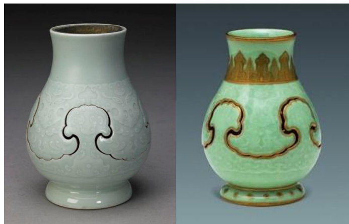
北京故宮館藏 (左) 及國家博物館館藏 (右) 乾隆粉青釉交泰瓶

唐英不僅可以把乾隆對瓷器的理念、想像和要求化成現實，更克盡心思，創新立異，為乾隆設計和創造不計其數的瓷器，當時的御窯廠，其實可以說是乾隆的玩物工廠。唐英奏摺中以「新擬得」來稱呼「夾層玲瓏交泰等瓶共九種」，又有「係奴才愚昧之見，自行創造」等語，可見上述言之成理。