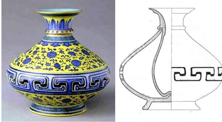
北京故宮藏乾隆黃地青花丁字紋交泰轉心瓶