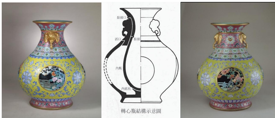
北京故宮藏乾隆黃地開光象耳嬰戲紋轉心瓶

另一件「天藍地鏤空轉心大套瓶」包含有外瓶、內膽和鏤空開光的組合。但啓動整件瓶子旋轉卻是由一根木製的長軸與八個銅片製成的勺形扇葉及木製菊花形齒輪組成。旋轉時必須注水入瓶，水流沿著置於瓶內的小銅管，緩緩地穿過瓷板，再往下沖流至內膽的勺形扇葉，水力沖動扇葉和齒輪旋轉，再帶動整個內瓶轉動，和今日之半自動裝置並無兩樣。