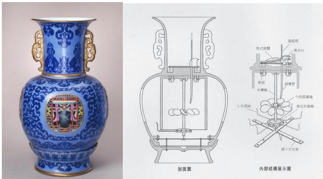
北京故宮藏乾隆天藍地鏤空轉心大套瓶及結構分析示意圖

另一件「天藍地鏤空轉心大套瓶」包含有外瓶、內膽和鏤空開光的組合。但啓動整件瓶子旋轉卻是由一根木製的長軸與八個銅片製成的勺形扇葉及木製菊花形齒輪組成。旋轉時必須注水入瓶，水流沿著置於瓶內的小銅管，緩緩地穿過瓷板，再往下沖流至內膽的勺形扇葉，水力沖動扇葉和齒輪旋轉，再帶動整個內瓶轉動，和今日之半自動裝置並無兩樣。