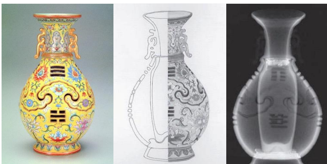
臺北故宮藏乾隆洋彩黃錦地八卦夾層玲瓏交泰轉心瓶外觀透視及X光透視

至於「交泰瓶」和「轉心瓶」之成型及製作技巧，筆者過去曾在《交泰瓶》一文詳釋過了。「夾層」、「玲瓏」和「交泰」三種技法，經常單獨或交互出現在一件作品上。但集三種技法於一身的，北京故宮藏的「洋彩黃錦地八卦交泰轉心瓶」可作為代表。