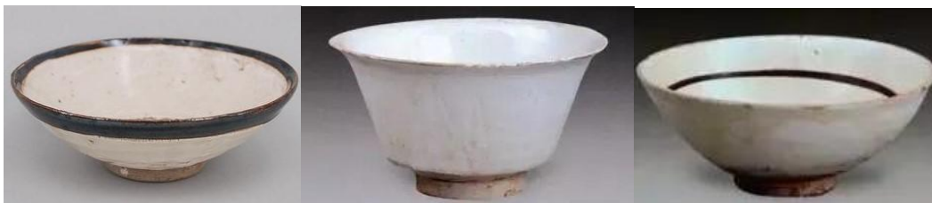
當陽峪窯白瓷茶盞三款

當陽峪窯是英商煤鐵採礦公司在1903年修鐵路發現的，但遲至1933年，本身也是收藏家的煤鐵採礦公司經理才雇人到當陽峪挖掘，得到了大批殘片及整器；發表了論文，後來在1941年，日本瓷家又發表有關當陽峪窯的文章，才引起我國古董商及藏家的注意。當陽峪窯器和元青花一樣，國人一向不識亦不理，完全是幾十年前方得外人重視，並研究、推崇，國人逐跟風從事收藏及商業活動。