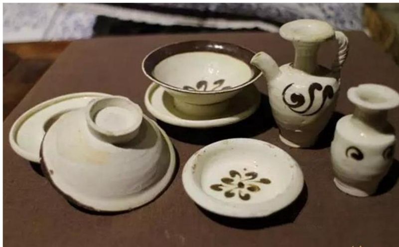
當陽峪窯細白瓷一組

其實當陽峪窯瓷器也不一定是粗胎，粗胎就是用含雜質較多的坯泥，由於胎體含鐵量較高，燒成後胎色多呈赤赭色、褐色和灰色。常見化妝土施至器物下腹部，罩釉則至器物下腹部或近足處。由於胎質粗厚，在很大程度上決定了器物的樣式和類型。常見器型有碗、盤、盞、罐、爐、器蓋、執壺等。其中碗、盤類佔大多數。