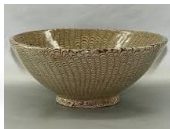
當陽峪窯紋胎碗三款

筆者作個文抄公，把報告中關鍵性的一段和瓷友分享：「在黃河以北的宋瓷除了曲陽之定、臨汝之汝以外，沒有一處能與當陽峪相媲美」。又云：「當陽峪窯的胎質較粗，多呈灰白、灰黑或黃褐色，有的燒結不夠充分，而吸水性較強。因此一般罐、瓶之類的儲水器裡面多有釉。而磁州窯的胎質則較細，多呈灰色，因吸水性較弱，故一般罐、瓶裡面很少掛釉；當陽峪窯釉層較薄而光澤較強，釉面多有細小開片，其中精品真做到了白如凝脂、黑似刷漆的程度。而磁州窯多是釉層較厚，光澤內含，色調白中泛黃黑中帶褐；當陽峪紋飾比較華縟，富於變化，主要是白地剝劃黑花之外，尚有赭、黑地剝劃花的作品，而磁州窯紋飾比較簡樸，兩者成就只在伯仲之間，難分甲乙。」這個簡述，清晰明瞭，可作為瓷友鑒定當陽峪窯器的參考。