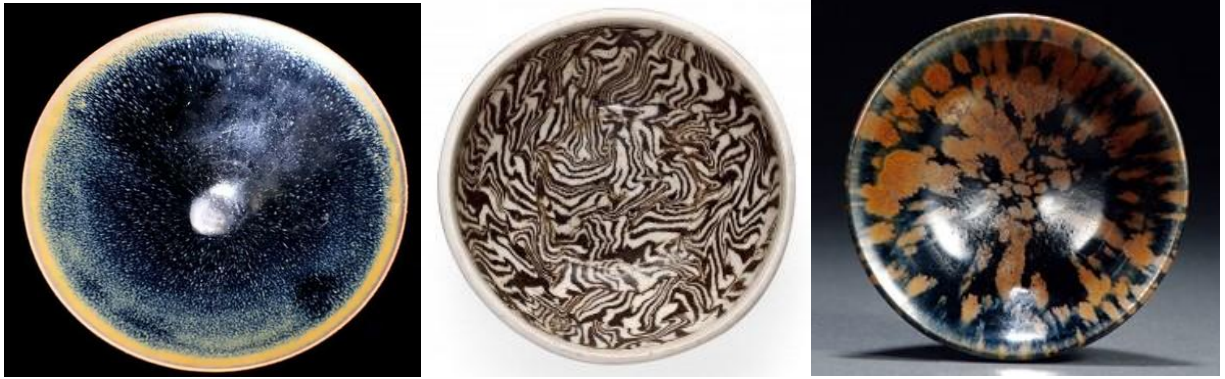
北宋當陽峪窯黑釉曜變飄花盞(左) 紋胎盞(中) 醬釉鐵繡花茶盞

其實當陽峪窯瓷器也不一定是粗胎，粗胎就是用含雜質較多的坯泥，由於胎體含鐵量較高，燒成後胎色多呈赤赭色、褐色和灰色。常見化妝土施至器物下腹部，罩釉則至器物下腹部或近足處。由於胎質粗厚，在很大程度上決定了器物的樣式和類型。常見器型有碗、盤、盞、罐、爐、器蓋、執壺等。其中碗、盤類佔大多數。