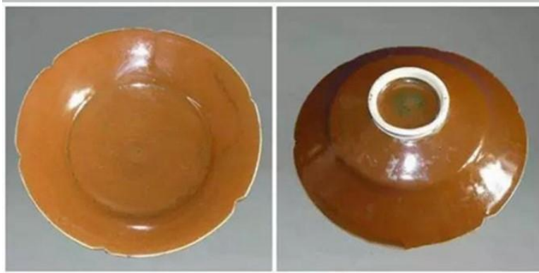
當陽峪窯折腰花口盞