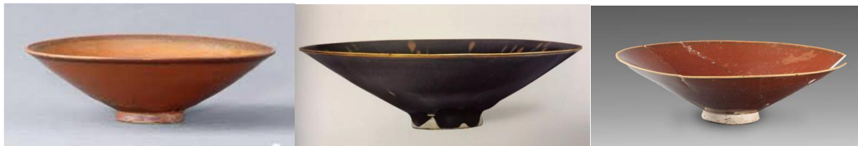
當陽峪窯斗笠茶盞三款

當陽峪窯位於河南省焦作市修武縣西村鄉當陽峪村，是我國宋代各窯口中相對的大窯區，內裡包括四十多個窯口。而當陽峪窯遺址東西長約2000米，南北寬約1000米。