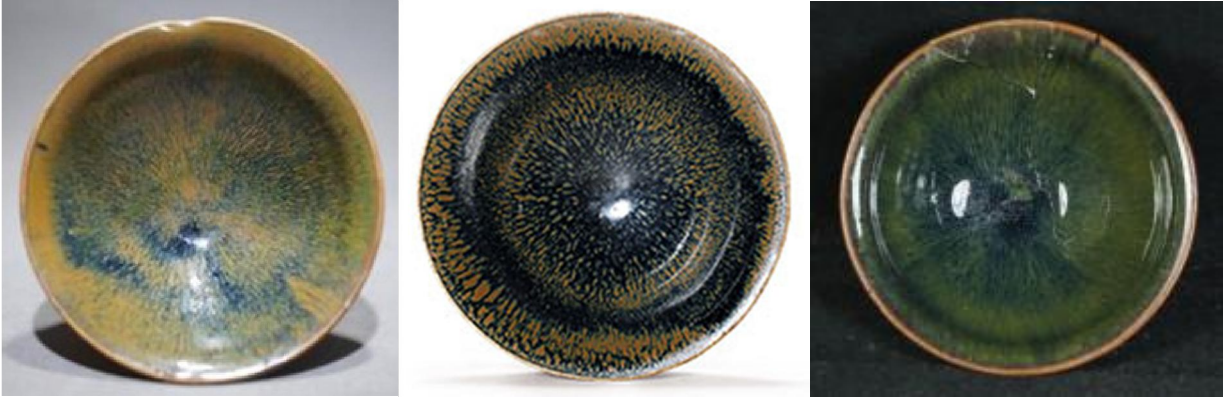
北宋當陽峪窯兔毫斑撇口盞三款

當陽峪窯系生產的白釉瓷器中，也有沒有使用化妝土而直接罩釉的，行話叫「細白胎一道釉瓷」，為最高端器皿。基本特點是胎色潔白，胎質細密，胎體很薄，瓷化程度極高。修足十分規整，內壁滿釉、外壁施釉至足跟，足沿、足內牆、足心露胎；也有施滿釉裹足刮釉，釉面光亮溫潤，局部有極細小開片。目前發現的細白胎一道釉瓷，大多採用支釘支燒，器心常見四個細小支釘痕跡。當陽峪窯的白釉瓷器中之精者，甚至為定窯所不及。而同樣胎質的醬釉、黑釉產品，則採用單獨匣鉢裝燒造。白瓷與色釉瓷的器型，主要是盞類。其實當陽峪窯亦燒製媲美建盞的兔毫斑茶盞；所以為什麼瓷友都追捧當陽峪窯茶盞，是有一定道理的。