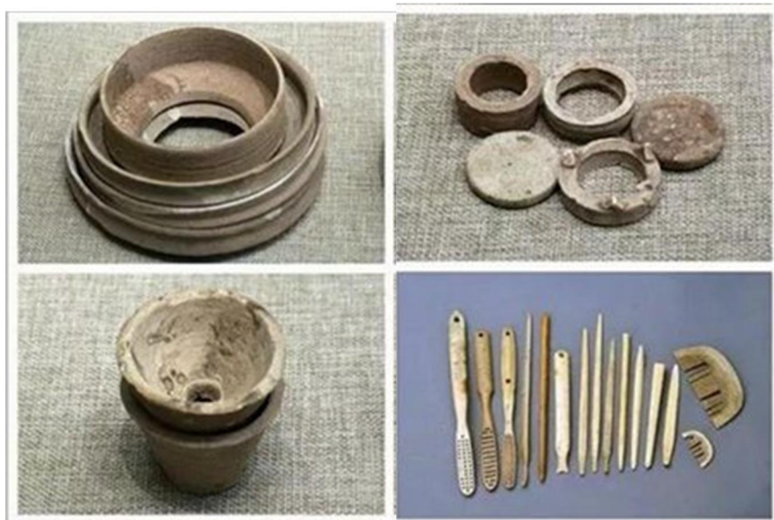
當陽峪窯遺址出土窯具

當陽峪窯系生產的白釉瓷器中，也有沒有使用化妝土而直接罩釉的，行話叫「細白胎一道釉瓷」，為最高端器皿。基本特點是胎色潔白，胎質細密，胎體很薄，瓷化程度極高。修足十分規整，內壁滿釉、外壁施釉至足跟，足沿、足內牆、足心露胎；也有施滿釉裹足刮釉，釉面光亮溫潤，局部有極細小開片。目前發現的細白胎一道釉瓷，大多採用支釘支燒，器心常見四個細小支釘痕跡。當陽峪窯的白釉瓷器中之精者，甚至為定窯所不及。而同樣胎質的醬釉、黑釉產品，則採用單獨匣鉢裝燒造。白瓷與色釉瓷的器型，主要是盞類。其實當陽峪窯亦燒製媲美建盞的兔毫斑茶盞；所以為什麼瓷友都追捧當陽峪窯茶盞，是有一定道理的。