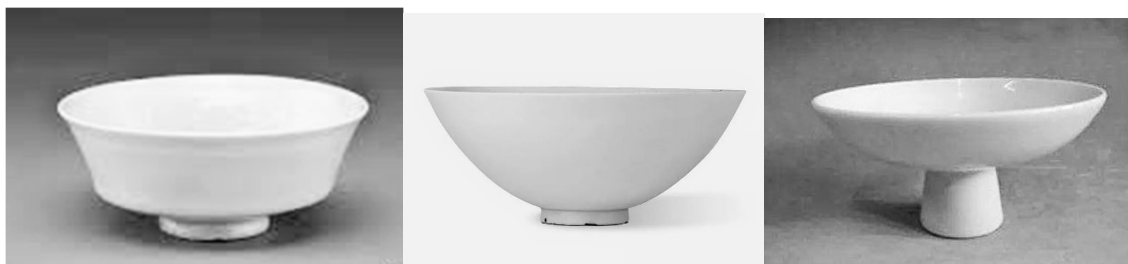
元代卵白釉折腰碗(左) 敞口碗(中) 高足碗(右)

這話就說得清楚了，卵白釉瓷等如就是當時的另類官瓷精品，非一般民窯可比。雖然沒有專門燒製樞府瓷的獨立官窯，但生產的窯口是當時「浮梁瓷局」管轄下的官瓷作坊，所謂「有命則陶」，說明這種官瓷不是常年生產，政府有訂單才開窯生產。卵白釉瓷自元代始窯，一直延燒到明初。洪武時曹昭《格古要論》有云：「元朝燒小足印花者，內有樞府字者高」。由此可知其品位。