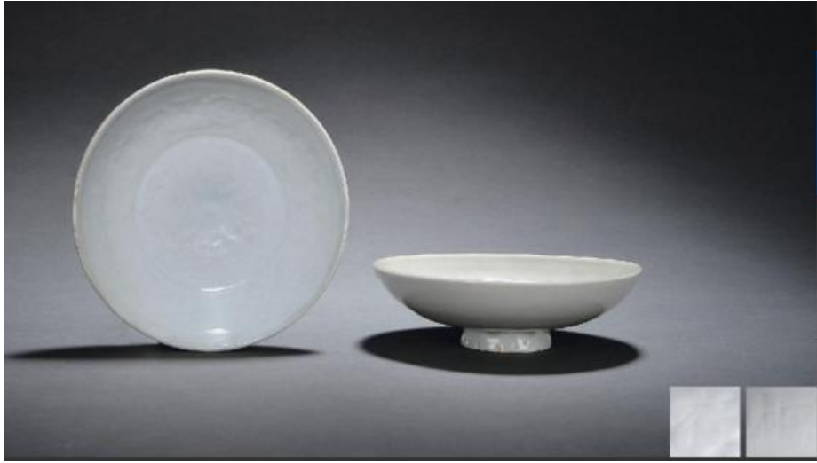
元代卵白釉供碟及「樞府」二字款