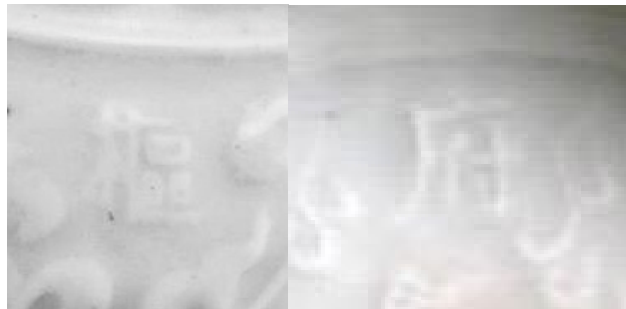
元代印花卵白釉瓷「樞」、「府」二字

「卵白釉」瓷創燒於元代，乃當時「樞密院」在景德鎮定燒的一種供官府使用之高檔瓷器。《元史·百官志二》云：「樞密院，秩從一品。掌天下兵甲機密之務」。樞密院由皇太子兼領，權傾天下。卵白釉瓷是在湖田窯青白瓷的基礎上發展而成，其色白而微青，明淨細潤，呈失透狀，頗似鴨蛋殼色，故名「卵白釉」瓷。器皿紋飾中又常印有「樞」、「府」二字，故又名「樞府瓷」。