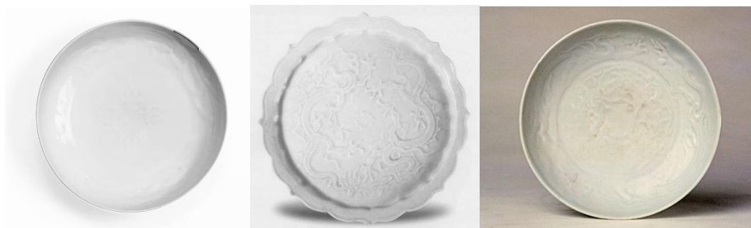
元代卵白釉印花盤三款

卵白釉官用的樞府瓷，一般燒成溫度都在1280℃上下，唯卵白釉使用的石灰釉含灰量為6至8%，氧化鈣含量低而氧化鈉的含量高，而且釉中含有異相顆粒，可導致光的散射。這樣不僅使其在高溫下粘度增大，不易流淌，並泛乳光。燒製時一般欠火，故釉面失透，亦導致玻化程度不高，故呈粉光。所用胎土，和元青花一樣，乃是選用元代官府壟斷的「御土」，亦即「麻倉土」燒造的。