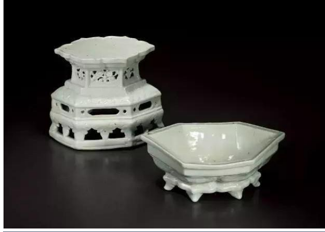
元代樞府釉六角香爐及台座拍品