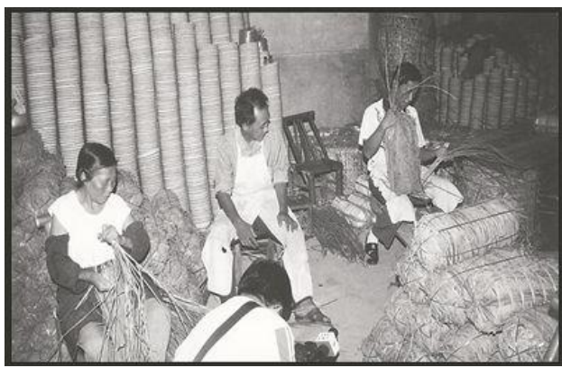
傳統稻草包裝非遺技藝 (攝於1970年代)