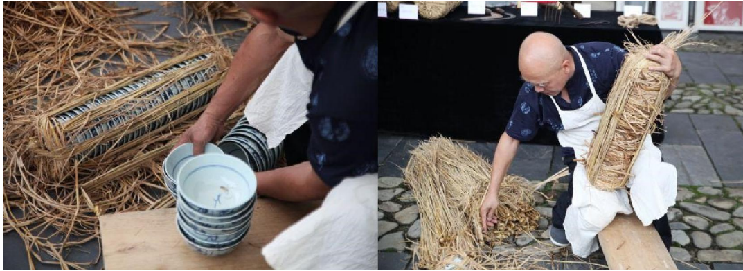
開始茭草 (左) 及完成 (右)

宋代時，運輸瓷器用特製木桶，周圍用秕穀稻殼填滿；而老百姓使用的一般瓷器，則用竹筐，周圍用碎稻草填滿即可。迄元代，因大量瓷器沿「絲綢之路」進入中亞的沙漠和草原，翻山越嶺抵到達波斯，迄地中海沿岸。地理和氣候條件導致木桶往往變形爆裂，遂逐步轉用稻草捆綁運送瓷器了。這就是茭草的起源。明代鄭和下西洋時，將稻草包紮的瓷器放入盛有黃豆和泥土的木桶中，黃豆長成豆芽，緊緊纏繞，更確保器物無損。我們今日看到當日沉船的出水瓷，都保存得完好無缺便是例證。