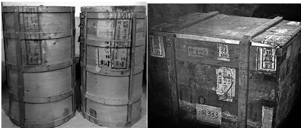
北京故宮藏民國時期郭世五私人瓷桶 (左) 及國寶南遷木箱 (右)

瓷友常說製瓷經過七十二道工序，其實明代宋應星在《天工開物》所敘述之所謂「過手七十二，方克成器」。實際上最後兩道工序「七十一·茭草」和「七十二·裝桶」，嚴格講和燒製瓷器無直接關係。