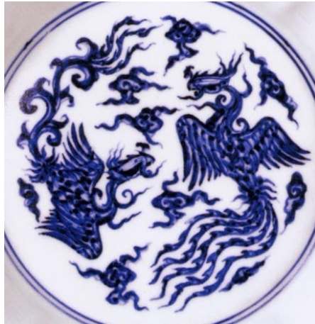
宣德卷草尾與五羽尾鳳紋