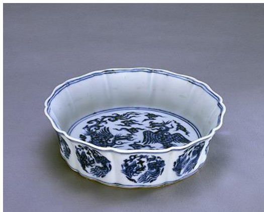
故宮藏青花鸞鳳紋葵瓣式洗