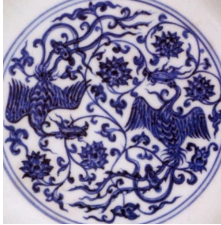
宣德三尾嵌靈芝鳳紋