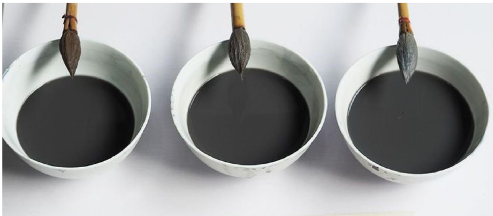
每種調製好的分水料

「分水」亦稱「混水」，為繪製青花最重要的工藝。簡單的說，就是在勾好的輪廓線內，根據畫面的需要，以事先調好、濃淡不同的青料水，在坯胎上繪填，形成不同層次，水料融滃的藝術效果；謂之「分水」。料水有分作「頭濃」、「正濃」、「二濃」、「正淡」及「影淡」起碼五種不同色階，與國畫中之「墨分五色」同一道理。