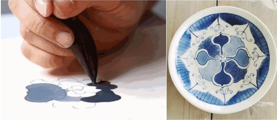
濃淡分水 (左) 及 完成 (右)

另要千萬注意在繪畫前，一定要將青花料水用筆攪拌均勻才使用，因為青花料水靜置在一旁不用時，粉料就很容易與水分離，沉澱在底部。如果在繪畫前沒有攪勻，水料分離，謂之「生水」，燒成瓷品後發色便會淡而無色，這種錯失，在坯體上事先是完全無法用肉眼辨別的。