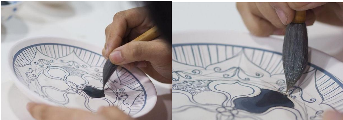
以料水暈染青花(左)及以筆尖吸回多餘的料水

生產過程為先以濕料勾勒好的圖案，若畫的線條太粗或畫的不滿意時，可用尖頭刮刀輕輕刮去錯處，再重新勾，繼而分水。分水時的基本技巧是以飽蘸了青花料水的雞頭筆，按住筆肚，用筆鋒將筆內青花料水蘊出。過程中速度要輕、要快而水勻，如此燒成效果自然清亮，沒有繪畫時的筆觸。一般的規律是坯體濕，運筆快，積水時間短，水色就淡。坯體乾，運筆慢，積水時間長，水色就濃。若當時蘊出的料水多，則可按壓筆肚將多餘料水吸回。