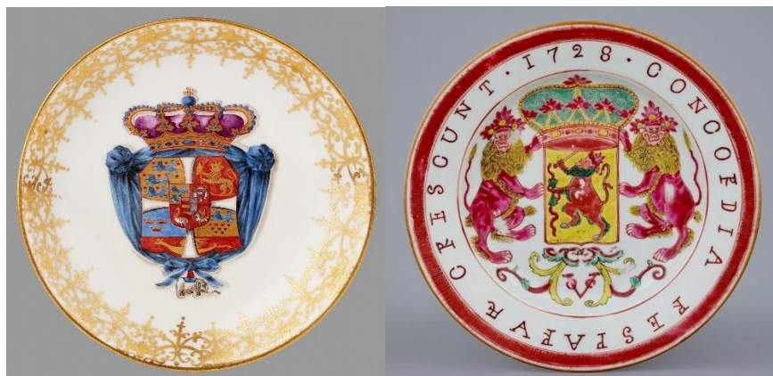
丹麥基士廷六世(左) 及 荷蘭東印度公司(右) 紋章瓷

自乾隆二十二年 (1757) 起廣州成為對西洋航海國家的唯一貿易口岸，直到光緒二十二年 (1842) 《南京條約》簽訂期間，據《粵海關志》統計，1758年到1837年的80年中，經粵海關入華貿易的外國商船共計5107艘。而英國東印度公司最早獲准在廣州設館貿易，當時歐洲流行中國風，皇家向中國訂製瓷器之餘，又作與將皇家徽章繪在瓷器上，王公大臣與及上流社會人士人莫不仿效，紛紛訂製有家族徽章的中國瓷器，謂之紋章瓷 (Armorial ware)。紋章瓷大致可分為家族徽章、城邦徽章、機構徽章、軍隊徽章等。文獻上顯示，原來在1774年時，英國倫敦專門代客經廣州定製私人紋章瓷的商人便有52人。