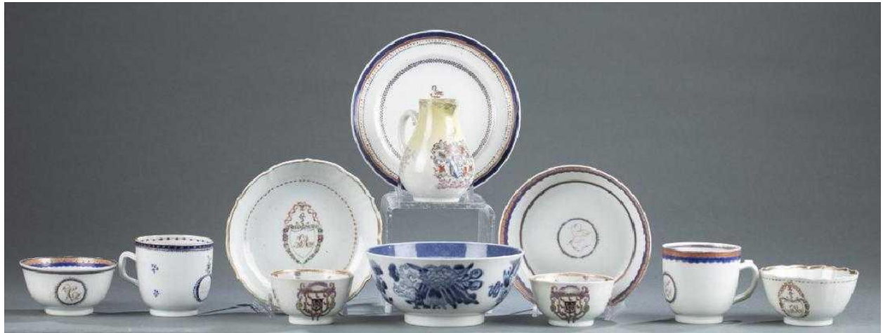
拍賣場上各式紋章瓷

其實家族紋章 (Coat of Arms)，在歐洲傳承有序，在英國甚至還有聯合王國家族紋章院 (The College of Arms, also known as the College of Heraldry) 的紋章官 (King of Arms) 專門主其事。歐洲以外，包括美國和各歐屬殖民地在內的上流社會東施效顰，自創家族紋章，則只能套用其中喜愛的某家族紋章式樣，改頭換面，加上自家姓氏而已。