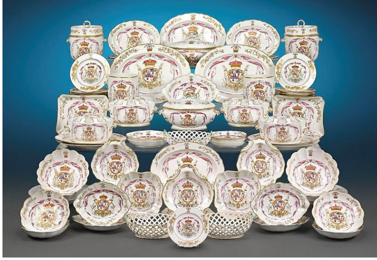
1780-90年代咸美頓公爵85件紋章餐具