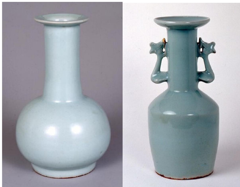
アルカンシエール藏龍泉窯青磁下蕪形瓶 (左) 及久保惣記念美術館龍泉窯青釉鳳耳瓶 (右)

茶盞中還有一隻日本國寶，就是京都相国寺 (Kyoto Sogokuji) 承天閣美術館 (Sotenkaku Art Museum) 所藏的一隻「宋代吉州窯玳皮天目散花紋茶碗」，也就是我們慣稱之為「剪紙貼花紋」的茶盞。此盞高 6.4cm，口徑 11.7cm，足徑 3.5cm。在 1953 年被指定為國寶。日本人稱此茶盞為「玳皮天目」，「玳皮」就是「玳瑁釉」之意。此盞本由萬野記念文化財團的萬野裕昭 (Hiroaki Mano) 擁有，在他創立的大阪萬野美術館 (Mano Art Museum Osaka) 展覽。1998 年萬野裕昭以九十六高齡逝世，他去世之後，萬野美術館又遇上財政危機，後於 2004 年閉館；其中大部分藏品包括此盞捐贈給京都市上京區的承天閣美術館。