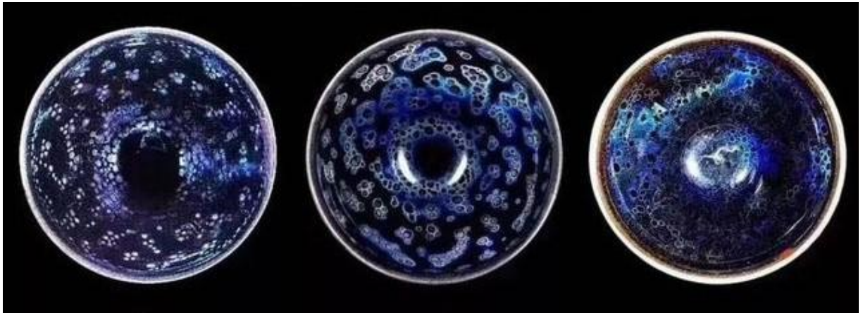
日本三大曜變天目國寶茶碗