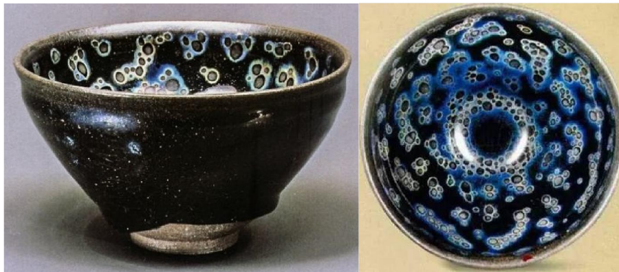
東京靜嘉堂文庫藏南宋曜變天目碗全景及鳥瞰

筆者從前有談過在日本大阪藤田美術館 (Fujita Museum, Osaka) 所藏之一隻南宋建窯「曜變天目茶碗」 (Yohen Tenmoku Chawan)，此碗高 6.6cm，口徑 12.3cm，內、外壁都結滿藍晶，世上僅此一例，所以瓷友褒稱之為「天下第一碗」。此碗源自江戶時代 (Edo Period 1603-1868) 德川家康 (Tokugawa Ieyasu 1542-1616)，大正七年 (1918)，藤田平太郎男爵 (Heitaro Fujita 1869-1940) 以 53,800 日元購得。是他的後代藤田傳三郎男爵 (Denzaburo Fujita 1841-1912) 創立的藤田美術館裡其中一件鎮館之寶。在 1953 年被日本政府認定為國寶。