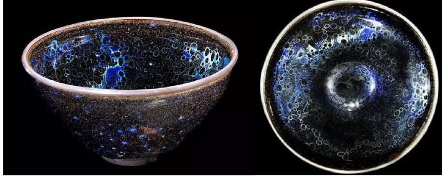
大阪藤田美術館藏曜變天目碗全景及鳥瞰

筆者從前有談過在日本大阪藤田美術館 (Fujita Museum, Osaka) 所藏之一隻南宋建窯「曜變天目茶碗」 (Yohen Tenmoku Chawan)，此碗高 6.6cm，口徑 12.3cm，內、外壁都結滿藍晶，世上僅此一例，所以瓷友褒稱之為「天下第一碗」。此碗源自江戶時代 (Edo Period 1603-1868) 德川家康 (Tokugawa Ieyasu 1542-1616)，大正七年 (1918)，藤田平太郎男爵 (Heitaro Fujita 1869-1940) 以 53,800 日元購得。是他的後代藤田傳三郎男爵 (Denzaburo Fujita 1841-1912) 創立的藤田美術館裡其中一件鎮館之寶。在 1953 年被日本政府認定為國寶。