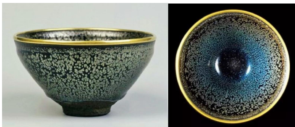
大阪東洋陶瓷美術館藏南宋油滴天目茶盞

藏曜變天目的龍光院，並不對外公開。龍光院是日本戰國名將黑田長政 (Kuroda Nagamasa 1568-1623) 安葬之所；「黑田」就是豐臣秀吉 (Toyotomi Hideyoshi 1537-1598) 的謀臣「官兵衛」黑田孝高 (Kuroda Yoshitaka 1546-1604) 的一家。龍光院中供奉著黑田家歷代祖先神位。龍光院也是「茶聖」千利休 (Sen no Rikyu 1522-1591) 的茶道中心，除這隻曜變天目建盞外，院中收藏的其他茶器，全是數百年傳承的珍貴文物。