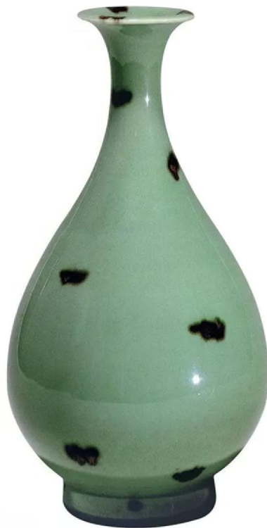
東洋陶瓷美術館藏元代龍泉窯鐵斑紋玉壺春

另一隻藏於大阪府和泉市 (Izumi) 久保惣記念美術館 (Kuboso Memorial Museum of Arts) 的南宋龍泉窯，日本人稱之為「青磁鳳耳花生銘万聲」的「青釉鳳耳瓶」。高 33.6cm，於 1951 年被指定為國寶。在傳世的宋代龍泉窯青釉鳳耳瓶中，以此瓶釉色最美。