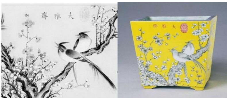
北京故宮藏大雅齋黃釉墨彩綬帶梅花紋長方花盆圖樣及實物

雍正、乾隆二帝熱衷參與官窯瓷器的設計和製作，因此特別重視「官樣」。以雍正五年閏三月初三日，造辦處的《記事錄》載：「朕從前著做過的活計等項，爾等都該存留式樣，若不存留式樣，恐其日後再做便不得其原樣。朕看從前造辦處所造的活計好的雖少，還是內庭恭造式樣。近來雖其巧妙，大有外造之氣。爾等再做時不要失其內庭恭造之式。」這段文字筆者從前有引用過，解讀的意思很多，但在此所謂的「存留式樣」，是否即是下次生產的「官樣」之意？