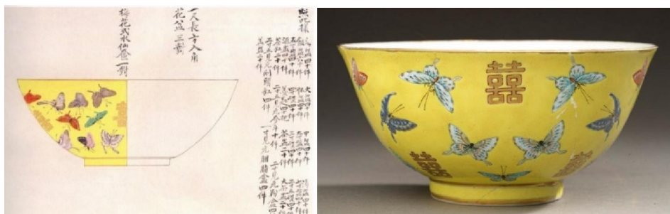
同治蝴蝶雙囍紋大婚用瓷圖樣及實物

其實古今中外一樣，很多設計師，本身並不精通生產技術和工序，所以工匠要將設計轉化成實物，便需要克服很多技術上的阻礙，才能配合設計所標榜的特色；所以御窯的工作人員，除要憑「官樣」上的各項細則來建立生產目標，如月生產量、交貨期，應用技術配合、應用工具配套、相應物料購存、人手調配、品質標準、管理配合、財務配合、生產成本計劃等等之外。可能比較重要的是預計將會面臨的生產困難，提早設想、試驗或準備可能的解決方案。種種基本上與現代勞動力密集型工業的生產無異。但以御窯廠而言，目的只有一個，便是最終產品，無可妥協地要和皇帝的要求相符合。