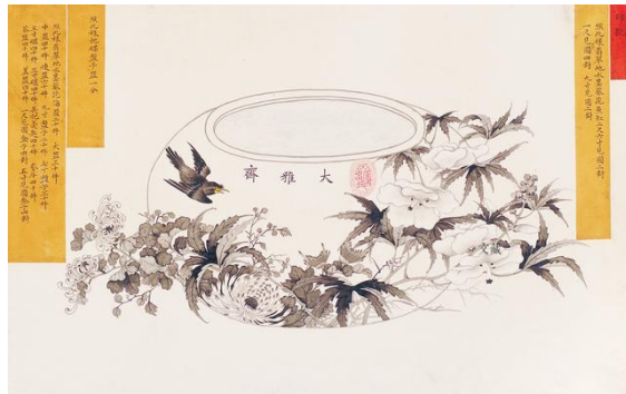
故宮博物院藏大雅齋水墨葵花魚缸官樣