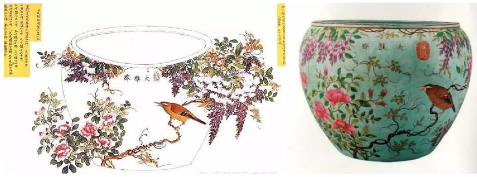
故宮博物院藏大雅齋藤蘿月季花魚缸圖樣及實物

今日能在故宮博物院考據的「官樣」圖樣很少，不要說清早、中期的了，即使是晚清御用瓷器的彩繪「官樣」，也只保存了一部分。根據這些「官樣」和館藏御瓷對比，原來當日按這些「官樣」燒製的瓷器，為數尚多，例如同治、光緒皆有燒造的「大婚用瓷」，這些瓷器都以日用器為主，有碗、杯、盤、碟、勺、盒、等。