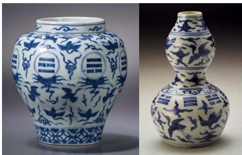
嘉靖青花雲鶴八卦紋罐 (左) 及雲鶴八卦紋瓶 (右)

「伏羲八卦」是以《易經·繫辭上》所說的：「易有太極，是生兩儀，兩儀生四象，四象生八卦，八卦定吉凶，吉凶生大業。」的生成原理所產生的。而「文王八卦」是以東南西北的方位來定八卦的位置，由於這種排列法可配合方位，也因此更廣為應用在風水上。