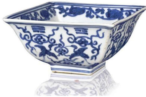
嘉靖青花八卦雲鶴紋方碗