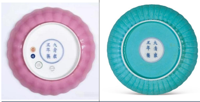
雍正十二色釉菊瓣盤兩種底款

十二色菊瓣盤，顧名思義為十二件一套，通體菊花瓣式，高度均約為 3.3-3.6 厘米，口徑介乎 16-17.5 厘米之間，足徑約 11.5cm。盤敞口，弧壁，圈足。圈足底款有二款，一為圈足內白底青花雙圈六字楷書款：「大清雍正年製」；另一為圈足內施滿釉，只露出雙圈六字楷款，亦書「大清雍正年製」。