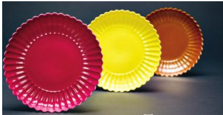
2017年嘉德春拍雍正十二色釉菊瓣盤三隻