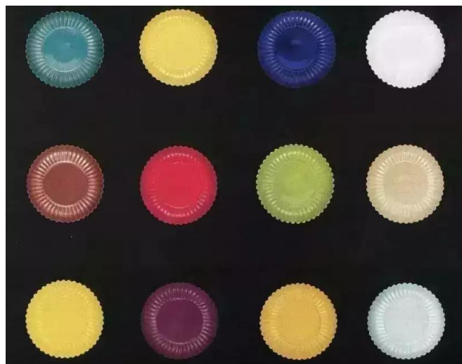
北京故宮藏一套12件雍正十二色釉菊瓣盤

瓷友大抵知道，燒製色釉瓷器，必有色差、色偏。同一釉色，在不同器形、不同胎質、不同釉料、不同溫度、不同氣氛、不同燒製時間、甚至不同天氣等細節的情況下，都會呈現不同的效果。那麼，這所謂「十二色」，未知當日是否以正色色系釐訂，例如紅藍綠黃白紫等，抑或也將同系偏色列作另一色？