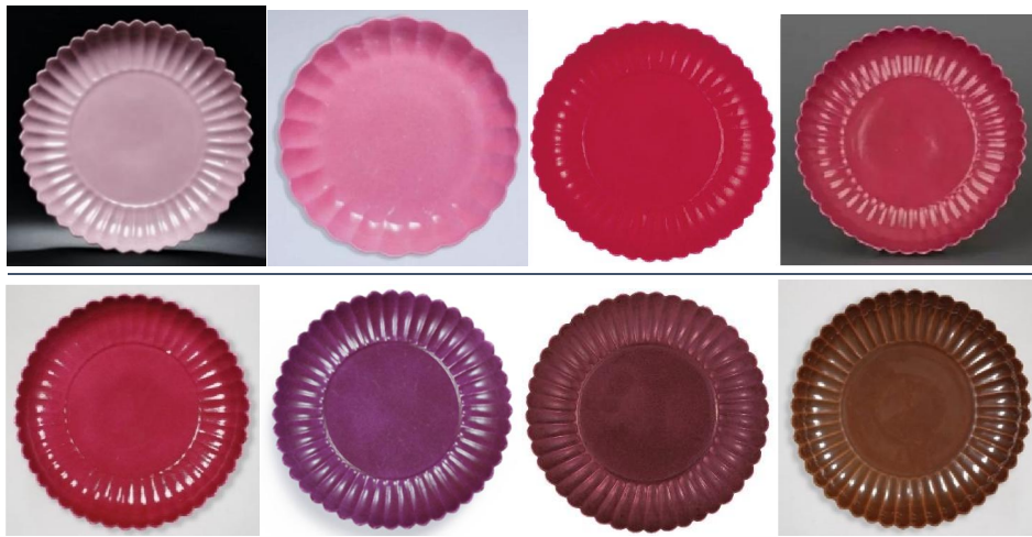
上左起：胭脂水、胭脂粉、胭脂紫、胭脂紅 下左起：胭脂紫、葡萄紫、茄皮紫。紫金釉

看了這麼多館藏的和上拍的「十二色雍正菊瓣盤」，比較了傳世品的各種釉色，感覺每一套的「十二色」都是勉強湊齊，無法確定雍正當時是看了什麼顏色配搭的一套菊瓣盤而雅興大發，一口氣訂製了 480 隻。但卻肯定了當時的十二色，並不以正色色系訂定，而是以同系偏色亦作一色論，所以其實不止十二色。因為無法集齊當時的 480 隻，亦無法得知實際共有多少顏色；我只能從各色實物中專誠製作了黃、綠、紅、紫同色系各種偏色給瓷友研究，這是在無法求証之中唯一的參考。