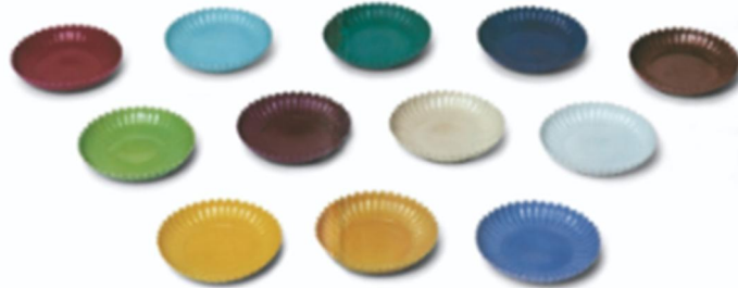
北京故宮藏另一套 12 件雍正菊瓣盤

參看北京故宮館藏的一套完整十二色菊瓣盤，可以看到黃釉、薑黃釉、明黃釉、米黃釉、胭脂紫釉、綠釉、湖綠釉、蔥綠釉、灑藍釉、豆青釉、醬釉、葡萄紫釉、白釉、十二種顏色。