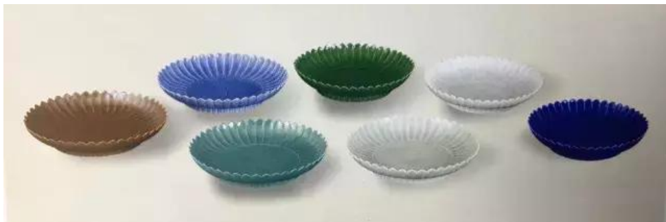
上博館藏雍正菊瓣盤七隻

《養心殿造辦處各作成做活計清檔》又載：「雍正十一年四月十七日，又送來各式菊花式磁碟十二色，內每色一件。奉旨：交與燒瓷處，照此樣式，每色燒造四十件。欽此。」這套畫樣被記作「各式菊花式磁盤十二色」。就是今天我們看到的「十二色菊瓣盤」。唯當年所呈和奉旨燒製的，究竟是那十二種釉色？卻並未留下明文記錄，今日只可以從傳世品探索一二。