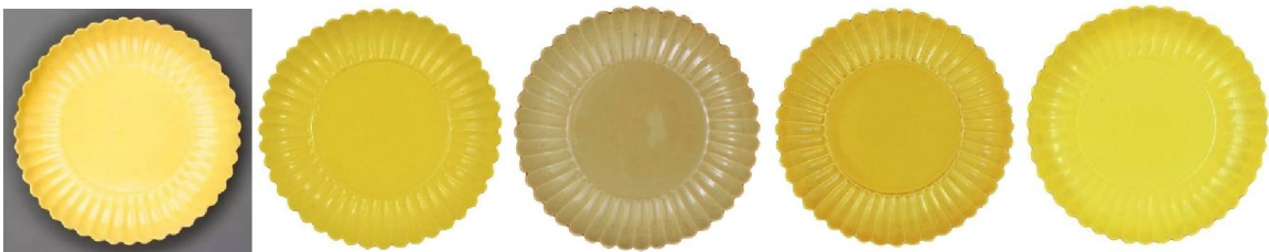
左起：檸檬黃、明黃、米黃、薑黃、正黃

又見北京故宮曾展出的另一套十二件雍正菊瓣盤，對比之下，這一組卻缺了白釉，而多了兩件孔雀藍釉。而上海博物館藏的一組雍正菊瓣盤，與故宮的十二色相比，則發現多了天藍、粉青、翠綠三色。