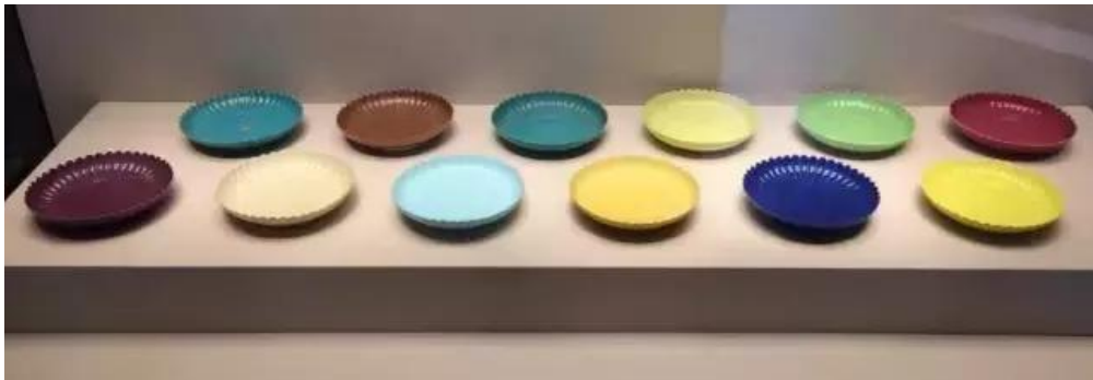
北京故宮曾展出的一套12件雍正菊瓣盤

可是看故宮藏的另一套十二色菊瓣盤，卻是黃釉、明黃釉、米黃釉、胭脂紫釉、綠釉、蔥綠釉、天藍釉、湖水藍釉、豆青釉、醬釉、葡萄紫釉、白釉十二種顏色。同上相比，多了白釉、天藍釉、湖水藍，但卻缺了湖綠釉、灑藍釉與薑黃釉。