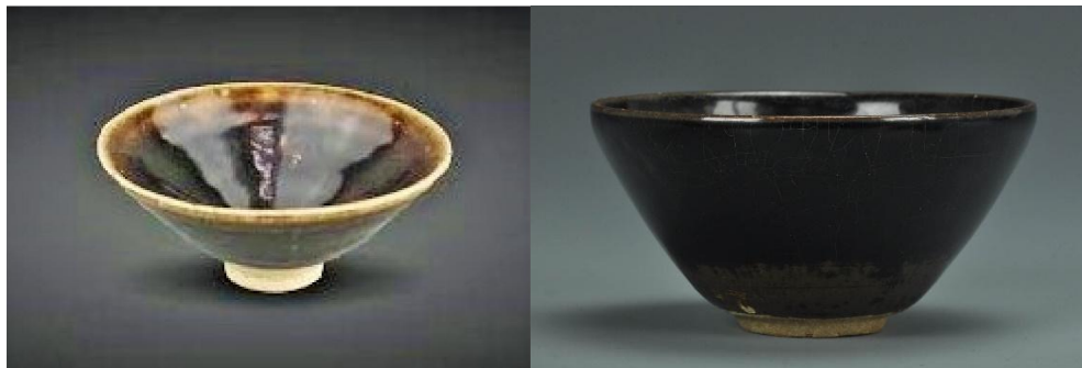
褐釉斗笠碗(左)及黑釉半圓碗(右)

宋代時全國黑釉瓷窯口甚多，不見有以木葉為飾者，唯吉州永和窯而已。木葉紋迄今未亦見於瓶、罐、盤、壺之類器物之上；只見於茶盞，而茶盞亦只有兩種，一是普通半圓碗，一是斗笠碗，且無一例外採用普通黑釉，只有少量用褐釉。