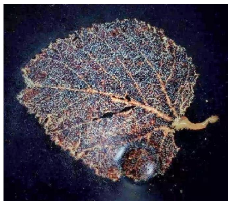
燒結後葉脈仍清晰可見

在吉州窯黑瓷虎皮斑、玳瑁釉、油滴釉、鷓鴣斑、剪紙貼花、木葉紋等眾多品種裡，最具禪意的，也是吉州窯獨有的，就是「木葉紋貼花黑釉碗」了。紋飾就是那麼簡單的一片葉子貼在碗心，有半葉、一葉，也有二、三葉疊加的。木葉貼花黑釉碗是吉州窯創燒的，未見於其他窯口。