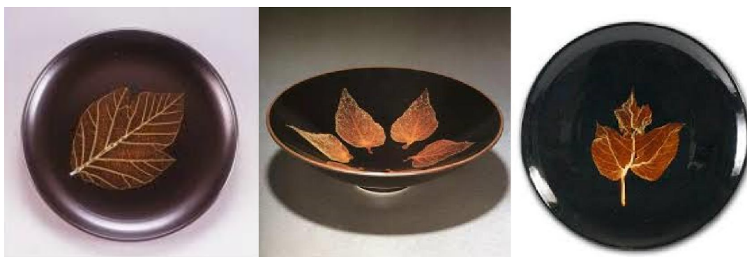
現代台灣木葉天目

現在台灣陶藝家，秉承中華傳統，又受日本文化影響，近年燒製了不少創新形態的木葉天目，以不同植物葉子配合較亮麗的黑褐釉，在傳統藝術中突顯了一丁點時尚與復古情懷。