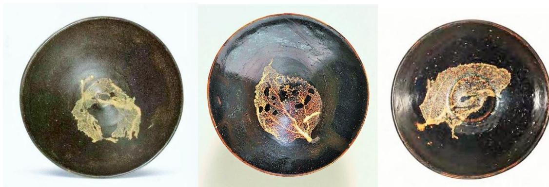
褐釉半葉(左)單葉(中)及雙葉(右)

木葉紋碗的製作工藝並不複雜，釉不及底，修足相對同期的兔毫盞、鷓鴣斑盞等較粗糙，所以可斷定並非宮中御用品，應該是民用的，而然，以其產量稀少，又不可能是一般民間日用器。就其禪意，前人推斷木葉碗可能是為禪寺僧人特別燒製的專用品種。吉州窯處於贛南地區，在唐、宋時期，贛南是中國禪宗寺院密集的地區，在此種特殊環境中，這推斷也許不無道理。