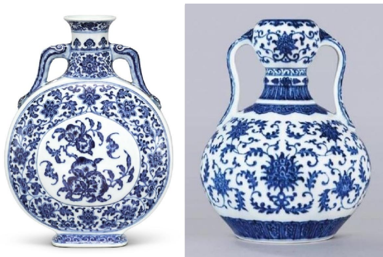
趙從衍舊藏乾隆扁壺 (左) 及綏帶瓶 (右)

趙從衍先生 (T. Y. Chao 1912-1999)，江蘇無錫人，經營華光航運，為香港一代船王，名聲僅次於包玉剛與董浩雲二位。趙氏精鑑古玩，他的「華光草堂」所藏明清瓷器皆絕世佳品。80 年代華光曾遇到經濟困難，趙光先生割愛數百件名瓷古玉，兩年套現 3 億港元；80 年代 3 億是超等鉅資了。趙先生收藏以瓷器為主，尤其青花為重要藏品。2017 年 11 月，香港蘇富比秋拍「中國藝術品」專場，推出多件趙先生舊藏重器。2018 年五月佳士得春拍亦推出十多件趙先生舊藏明清青花珍品。