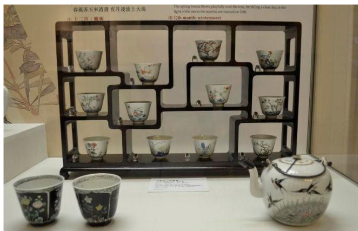
羅桂祥茶具文物館的十二花神杯

羅桂祥博士 (Dr. Lo Kwee-seong 1910-1995)，廣東梅縣人，維他奶創辦人，陶瓷茶具收藏家。他於 70 年代在蘇富比宜興專拍中拍了一批紫砂茶壺，自此便開始了陶瓷茶具收藏。早於 79 年改革開放之初，他就已到宜興考察，還與顧景舟、蔣蓉等製壺大師專題座談，並向二十多位做壺能手訂製了 580 多件/套紫砂工藝壺。他又周遊列國，重金收購了古今名壺 200 餘種。後於 1981 年 10 月將 476 件各類陶瓷茶具捐獻給香港市政局，香港政府特別撥出中的前三軍司令官邸改建成「羅桂祥茶具文物館」，永久陳列他的藏品，其中包括英國大衛德爵士 (Sir David Percival) 舊藏的一件清雍正鬥彩松竹梅紋酒壺，和一套完整的清康熙五彩十二花神杯，這些都可以在茶具文物館欣賞到。