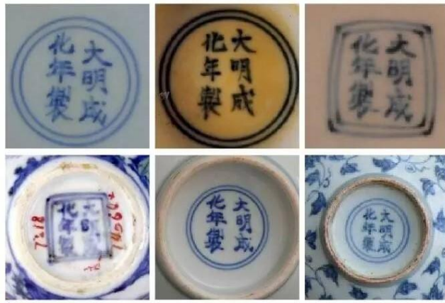
北京故宮藏部分成化瓷器底款