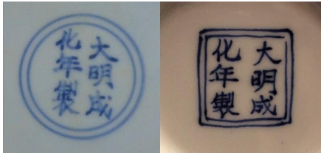
景德鎮御窯遺址博物館藏陂塘青(左)及回青(右)底款比較

在成化官款青料發色存在上述這種現象的，不止只有雞缸杯，其他成化官窯瓷底款也有這種現象。當時瓷品採用的鈷料有回青、陂塘青(平等青)、及回青／陂塘青混合料。嘉靖年間的《江西大志書》記載製煉回青是用淘青法，即用進口蘇青加國產陂塘青配比，碾碎後用水攪拌，用磁石吸取鐵雜質，把漿水沉澱烘烤曬乾，每斤可得5錢左右的青料。