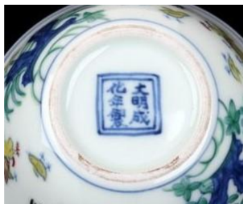
民國仿成化鬥彩雞缸杯底款

在景德鎮編號「87 珠成 H1」成化層出土的殘器，因為成化即位的頭三年無有關製瓷的文獻記錄，所以應該是成化四年之後成化早期的製品，當時青料既用蘇青，也有陂塘青。而編號為「88 珠成 H3」則為成化晚期地層，此時期則以陂塘青為主。所以成化一朝青花，既有深邃幽沉、亦有淡雅清平的發色，器身亦然，底款亦然。