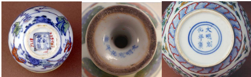
鬥彩人物紋碗(左) 鬥彩團蓮紋高足杯(中) 成化鬥彩折枝蓮紋罐(右)

孫瀛洲先生在1959年發表了《成化官窯彩瓷的鑒定》一文，把他數十年親近成化官瓷的經驗和大眾分享，亦總結了他對成化官款的觀察。我有幸後來有機會參予研究成窯出土殘器，將實物引証孫先生的理論，很是佩服孫先生的觀察力和分析能力，尤其對他創作的鑒定成窯瓷器的口訣，我認為已得鑒定成化底款的神髓，難怪以後瓷友奉為圭臬。