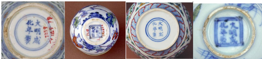
北京故宮藏部分成化瓷器款識

成化官窯瓷器底款，以雙圈及雙方框為主，最常見者為「大明成化年製」六字款。後世仿製成化瓷器，亦大多書六字款。但成化真款字體，並不規整，有類稚子手筆。著名古陶瓷鑒定專家孫瀛洲先生在其著作談到成化官窯款時說：「成化官窯器的款識多用藏鋒筆法，故少有纖細的筆鋒；而且筆道粗、字體肥，柔中含有剛勁，格外顯得圓拙有力極有含蓄」。