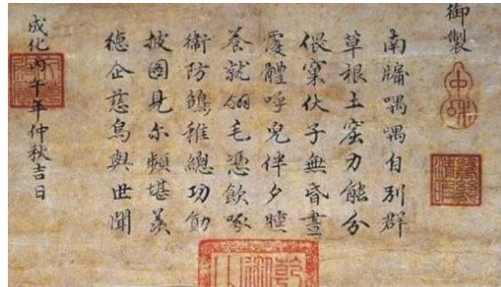
成化二十二年(1486年) 成化39歲御筆

才可一寫20年 (成化即位頭三年沒有燒瓷，而成化二十三年九月明孝宗弘治繼位第一年仍沿用)。猶如雍正時期，凡字都指定由戴臨負責，而徐國正則專司寫款一樣道理，未審瓷友以為然否？