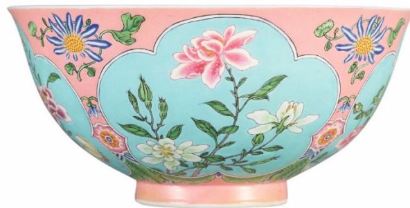
康熙粉紅地琺瑯彩開光花卉盃

而最新的二億元瓷器俱樂部會員乃2018年4月3日上午，香港蘇富比拍出的「奈特琺瑯彩盃」（H.M. Knight Falangcai Bowl），此康熙粉紅地琺瑯彩開光花卉盃，與臺北故宮藏品「康熙瓷胎畫琺瑯粉紅地花卉紋碗」不論在器型、彩料、紋飾和落款上都有頗多類似之處，而琺瑯彩瓷碗粉紅色釉與松石綠，目前僅臺北故宮一例。該碗以1.4億港幣起拍，2.1億港幣落槌，加佣金共2億2千239萬港幣成交。