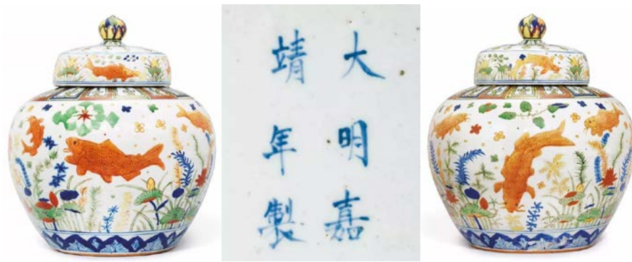
明嘉靖五彩魚藻紋蓋罐全圖