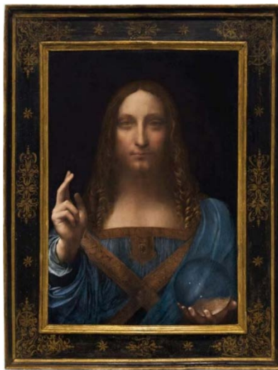
達文西作品《救世主》

如此說來，三秋杯能拍個 5 億美元，不會是異想天開，反而希望北京故宮將之上拍，可能是椽木求魚了。