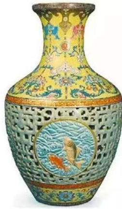
清乾隆粉彩鏤空轉心瓶

話分兩頭，目前全球最高貴的藝術品，不是瓷器，而是 2017 年紐約時間 11 月 15 日晚，在紐約佳士得拍出了 4.5 億美元 (約 28 億元人民幣、35 億港幣) 的達文西 (Leonardo da Vinci) 作品《救世主》 (Salvator Mundi)。此畫刷新了全球藝術品拍賣最貴紀錄。此畫縱然有傳聞是達文西的弟子所作，及作品有大量修復的痕跡。但買家沙地阿拉伯王子 Mohammed bin Salman Al Saud 卻願意花上 4.5 五億美元收藏，並將之放到阿布達比羅浮宮 (Louvre Abu Dhabi UAE) 展出。