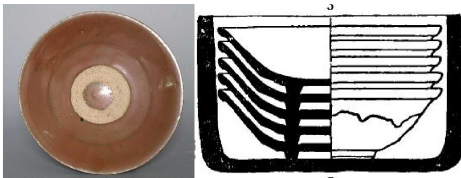
澀圈疊燒成品和裝匣透視

為着防止粘連，通常是把碗內部的釉刮掉一圈，大小和底足一樣，再把另一個底足無釉的碗放上去。碗和碗之間只有澀胎接觸，就不會粘結了，這種叫「澀圈疊燒」。澀圈燒的碗省是省了，但碗內有缺釉的部分，極不美觀，今天瓷友亦只把澀圈燒的碗、盤等作標本多於觀賞、實用。