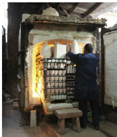
現代氣窯裝窯示範

現代燒窯，已不用柴，差不多全面用氣窯了，氣窯沒有煙塵飛灰，自然用不著匣鉢，瓷器直接擺放在窯板上便成，的確省事多了！