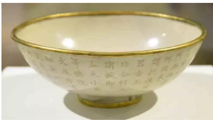
大英博物館藏金扣定窯白釉碗 - 上刻乾隆御詩