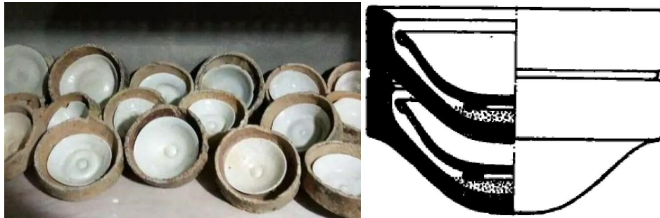
單燒匣鉢和裝匣透視

比較通行而對品質有保障的匣燒方法叫「單燒」，就是一個匣鉢只放一件器皿的燒法，這種燒法的優點是，除了接觸匣底層墊片的器皿底足一圈無釉以外，通體有釉。單燒的裝窯方法，是把裝了器皿的匣鉢疊起來，上面匣鉢底就是做下面匣鉢的蓋，但匣鉢疊起來不能過高，否則未燒即塌。以碗做例，一般只能疊十多二十個匣鉢而已，因為空間不能盡用，若燒製普通瓷品，間接成本便相應高了，所以單燒一般都用於精細瓷器，例如官窰瓷器。