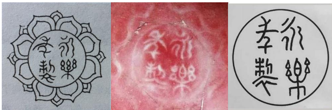
永樂團花(左)紅款(中)單圈(右)款

永樂 (1403-1424) 在位時做了幾件大事，就是編纂《永樂大典》、遣使七下西洋、蓋了世上最大的宮殿，也就是今天的北京故宮。在瓷友眼中永樂在陶瓷史上更大的貢獻，為曾燒製大量奉佛的白瓷，他燒的甜白瓷，質量是其他朝代無法超越的。在青花瓷方面，更開創了一個嶄新的局面，以蘇麻離青，配合麻倉官土，再加上卓越的繪畫技巧；永、宣青花，亦是他朝難以超越的。