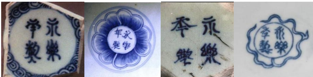
天啟仿款(左) 萬曆仿款(左二) 康熙仿款(右二) 民國仿款(右)

據明末清初谷應泰著《博物要覽》記載：「永樂年造壓手杯，坦口折腰，沙足滑底，中心畫雙獅滾球，球內篆書『大明永樂年製』六字或四字，細若粒米，此為上品；鴛鴦心者次之，花心者又其次也。」但「鴛鴦心」及「六字篆書」款還未見有實物。至於暗刻篆體「永樂年製」官款，多刻在器內底心或內壁，字體風格與青花書寫篆體款相近，稱之為「暗款」。比如北京故宮博物院收藏的甜白釉暗刻龍紋碗，內底亦暗刻四字雙行篆書款。暗款多刻劃較淺，又是釉下，所以不甚清晰。