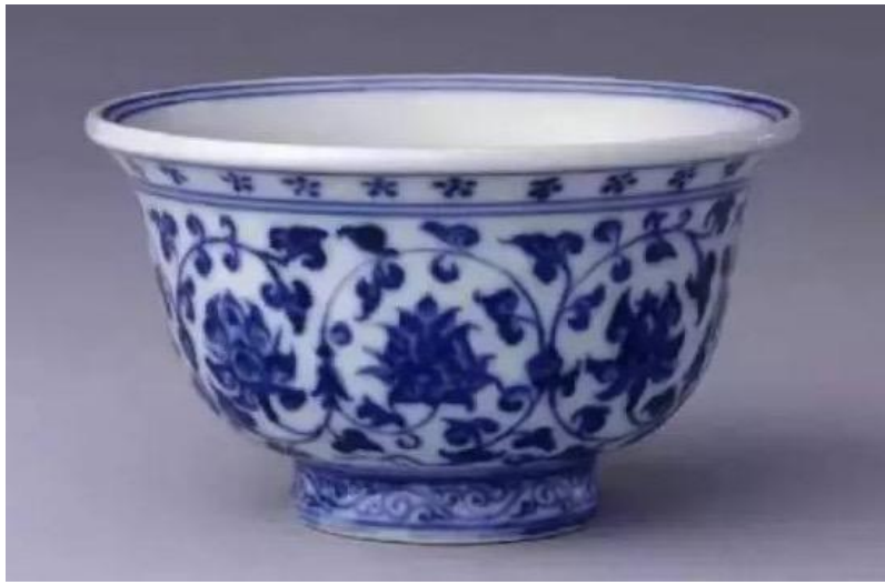
北京故宮藏明永樂青花壓手杯