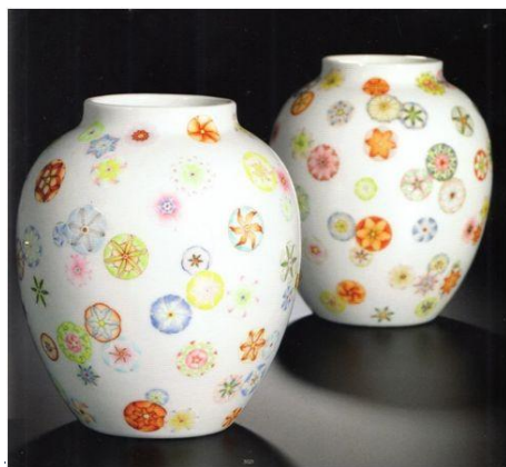
乾隆粉彩皮球花紋罐一對

當時景德鎮御窯廠將東洋的「皮球花」紋樣革新，以粉彩或斗彩描繪紋樣，遂成雍正一朝之名品而歷久不衰。雍、乾兩代燒製尤多，但大方得體而精美的，以罐為最，傳世亦以罐最得瓷友心，但可惜成對者甚少，博物館所見亦多見單隻而已。難怪年前香港蘇富比拍賣一對乾隆粉彩皮球花紋罐，會叫價3,000至4,000萬港幣了。