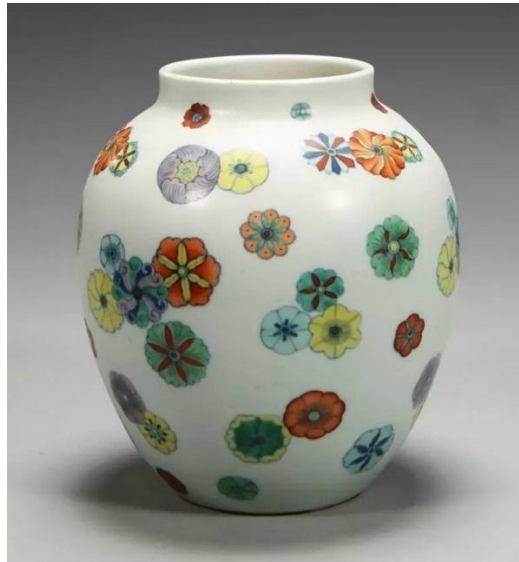
北京故宮藏雍正皮球花罐

所謂「皮球花」，並非一種特定花卉紋飾，例如「纏枝蓮」、「寶相花」之類。「皮球花」實則是一種變形的裝飾方法，把各種花卉紋樣，一律衍化成大小相若，呈放射狀或旋轉式圓形紋樣，但細節花紋和色彩不一的球形。