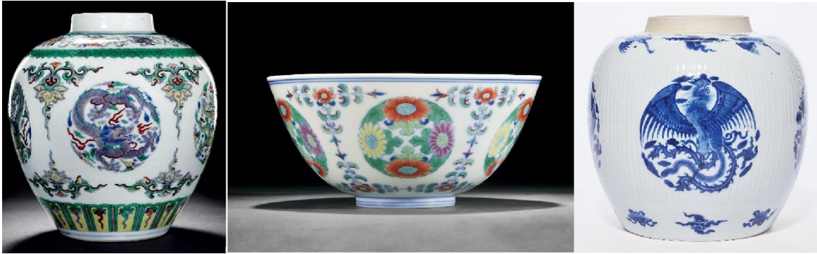
團龍(左) 團菊(中) 團鳳(右)

「皮球花」通常在三釐米之間，作為器物上的裝飾，疏密有致，有聚在一處邊靠邊的，有重疊的，有散佈的。因為紋樣的特點為圓圓的一團，所以又稱「團花」。唯「團花」一名雖然文雅，但容易與明、清時期流行的圓形圖案相混淆，例如「團菊紋」、「團龍紋」、「團鳳紋」等。以資識別，所以還是「皮球花」一名來得親切。