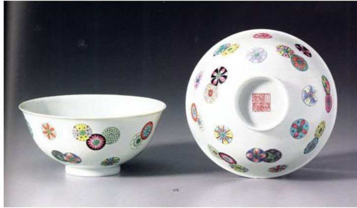
清嘉慶粉彩皮球花碗一對