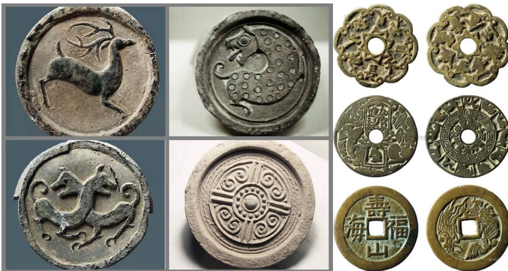
漢代瓦當(左) 與 清代花錢(右)

有云皮球花源於殷商青銅紋飾，但我卻在青銅器上卻少看到正圓形的「團花」。但漢代瓦當，在規範的正圓花樣紋飾上，卻給了後世「團花」大量設計靈感。另外我國歷朝的花錢，例如乾隆十四年編纂的《西清古鑑》，便登錄了先朝種種花錢，式樣與「皮球花」的設計有若干程度的接近，雖然風格迥異。