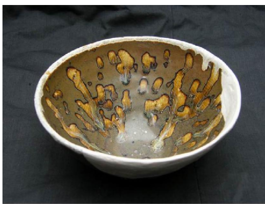
西壩窯鷓班茶盞殘器