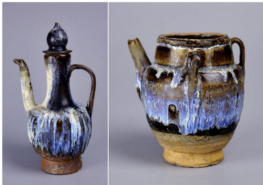
西壩窯窯變執壺二例

西壩窯瓷器器形多樣化，博物館展示的就冇罐、瓶、爐、壺、鉢、盤、碗、盞、燈、香熏、燭臺等等。就是因為器形多，所以因應不同器形而施的修底足工藝也多多樣化；有餅型、寬圈、環狀、玉璧底等等。西壩窯瓷器一般坯胎厚重，工藝粗糙，利坯草率，修坯痕和接胎痕跡明顯；施釉亦大而化之，一般施釉不到底，釉層厚薄不勻，常見流釉、漏釉現象；以黑色釉和醬釉為基本色釉，也常用褐色釉和灰白釉。總體風格是豪放粗獷，但窯變效果卻多姿多采，呈現既斑駁又有致、既溶融又擴散的藍、白、灰、黃、紅等窯變條紋，美不勝收。