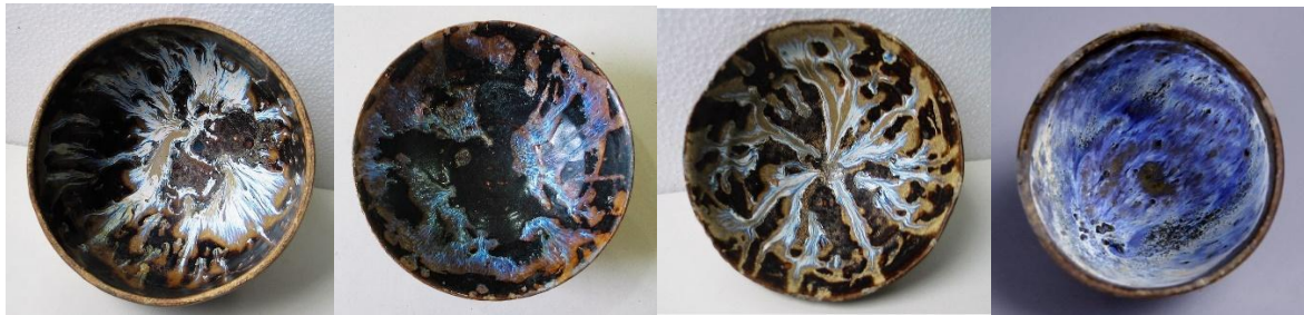
西壩窯茶盞窯變效果

根據西壩窯研究者報告分享，西壩窯也生產少量的品質精細，用料講究、修坯均勻、施釉精細，全身滿釉，色調全黑或全紫的器物和具有各色花斑條紋的產品。窯變效果有藍兔毫紋、白兔毫紋、玳瑁斑、油滴斑、虎皮斑、醬紅色斑、醬黃色斑、不規則花斑等等，皆具觀賞價值。品質上乘者，甚至可以媲美建窯、吉州窯。