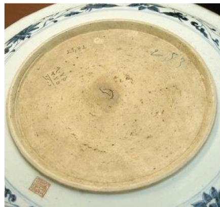
元青花大盤底部麻倉土

元青花成為西亞各國宮廷用具，是包含着政治、宗教、文化、美術、實用等種種因素。而伊兒汗國是當時的經濟文化中心，所以在今日伊朗阿德比爾神廟博物館（Ardebil Shrine）是藏傳世元青花最多所在之一，良有以也。