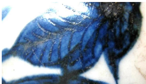
蘇麻離青近鏡之一

前拙文曾有談及四大汗國之一之伊兒汗國位於今日中亞南部至西亞一帶，首都最先在蔑刺哈，即今伊朗的馬拉蓋 (Maragheh)，元代譯為「蔑刺哈」，後遷都至伊朗東亞塞拜疆省 (East Azerbaijan) 之大不裡士 (Tabriz)，最後定都今伊朗西北部之蘇丹尼耶市 (Soltaniyeh)，為當時的經濟文化中心。