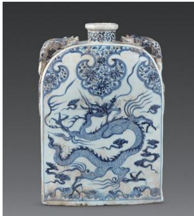
元青花龍紋四系扁瓶

按當時浮梁瓷局的管轄和工作範圍，職權應該相當大了，可是為什麼其主管才只不過是區區一個「秩正九品」官呢？如果以清代督陶官唐英為例，他官居正三品；他的前任年希堯為正二品，再上一任郎廷極更厲害，是從一品。原來因為元代實行的是「官匠」制度，專設「匠官」來管理各業的「官匠」，匠官的官位在至元九年(1272年)以後，有明確規定：「一百戶之上，大使從七品，副使從八品。一百戶之下，院長一員，同院務，例不入流品，量給食錢。凡一百戶之下管匠官資品，受上司劄付者，依已擬充院長。已受宣牌充局使者，比附一百戶之上局使資品遞降，量作正九資品」。所以匠官品位按其管理戶口而定，可知在1278年時，景德鎮只是一個小鎮，人口只在百戶之間。