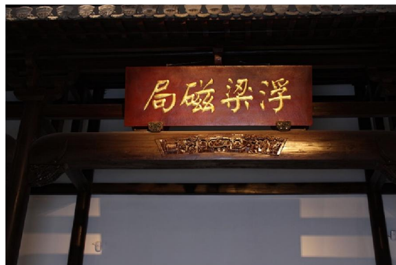
景德鎮陶瓷館內浮梁瓷局復原貌

元於1279年滅南宋，統一了全國之前一年浮梁瓷局已設立了。《元史》載：「浮梁磁局，秩正九品，至元十五年立，掌燒造磁器，並漆造馬尾棕藤笠帽等事，大使、副使各一員」。史志記載，非常清楚，浮梁瓷局在至元十五年(即1278年)設立，而浮梁瓷局的職責也有明確介定為「掌燒造磁器，並漆造馬尾棕藤笠帽等事」。從字面理解，應該是負責管理包括瓷器在內的多項日用品。