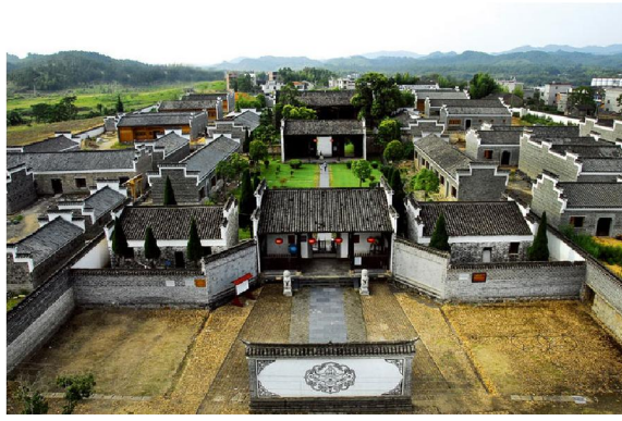
景德鎮浮梁古縣衙全景