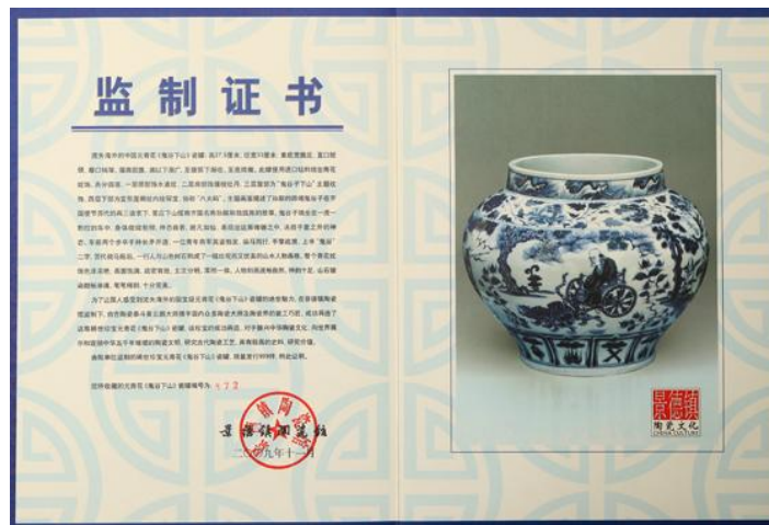
高仿元青花幾可亂真

所以今日評鑒「元青花」，瓷友共識必基於三之大要素，一為景德鎮浮梁瓷局精工製品，二為青料使用進口「蘇麻離青」，三為瓷土使用「麻倉土」。三者缺一，只能稱之為廣義的「元代青花」，絕不能僭越倭稱之為「元青花」。