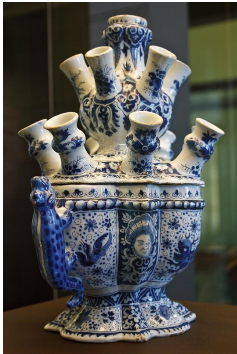
鹿特丹范伯寧恩美術館藏特爾夫特多管瓶