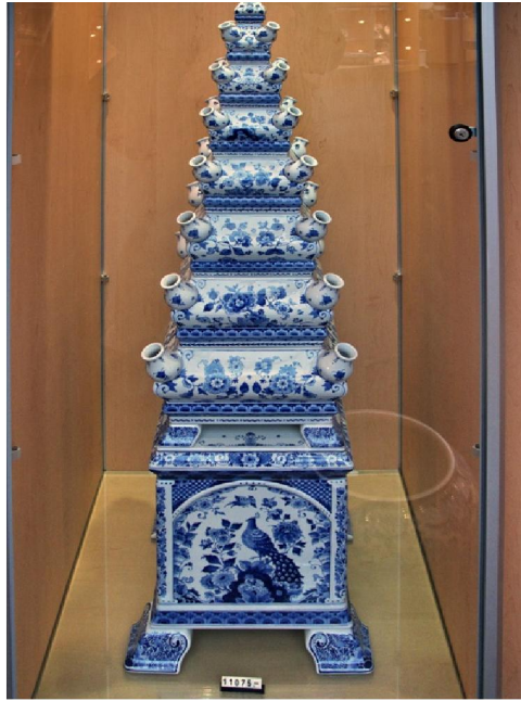
皇家台夫特藍陶工廠的鬱金香花瓶

17世紀中，中國青花瓷也外銷到英國，但價格昂貴，當時是達官貴人的專利品，受荷蘭青花啓發，也在倫敦 (London)，布里斯托 (Bristol)，林伯芙 (Lanbeth)，諾域 (Norwick)，修獲 (Southwark) 等地；18世紀則又在利物浦 (Liverpool)，格拉斯哥 Glasgow)，雲肯頓 (Wincanton) 等地設廠生產專為中產階級燒製的、相對便宜的代用品 - 英國特爾夫特陶器。但可惜英國製品非常粗陋，相對坯胎較厚，釉料粘結度較差，釉面常帶棕眼氣泡，畫工較荷蘭粗糙，迄18世紀末，便衰落了。