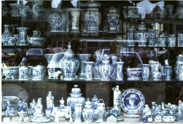
各式荷蘭青花陶器

當時光特爾夫特市就有三十幾家的製陶工廠，另外阿姆斯特丹 (Amsterdam) 和鹿特丹也設有不少陶瓷廠，並發展成了名重一時的「特爾夫特荷蘭青花」。而「特爾夫特」後來也被用來稱呼這種特定風格的白底藍花繪畫紋飾的陶器和瓷磚。