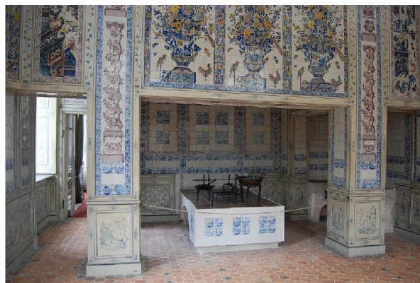
德國寧芬堡宮內部特爾夫特瓷磚裝飾

當時光特爾夫特市就有三十幾家的製陶工廠，另外阿姆斯特丹 (Amsterdam) 和鹿特丹也設有不少陶瓷廠，並發展成了名重一時的「特爾夫特荷蘭青花」。而「特爾夫特」後來也被用來稱呼這種特定風格的白底藍花繪畫紋飾的陶器和瓷磚。