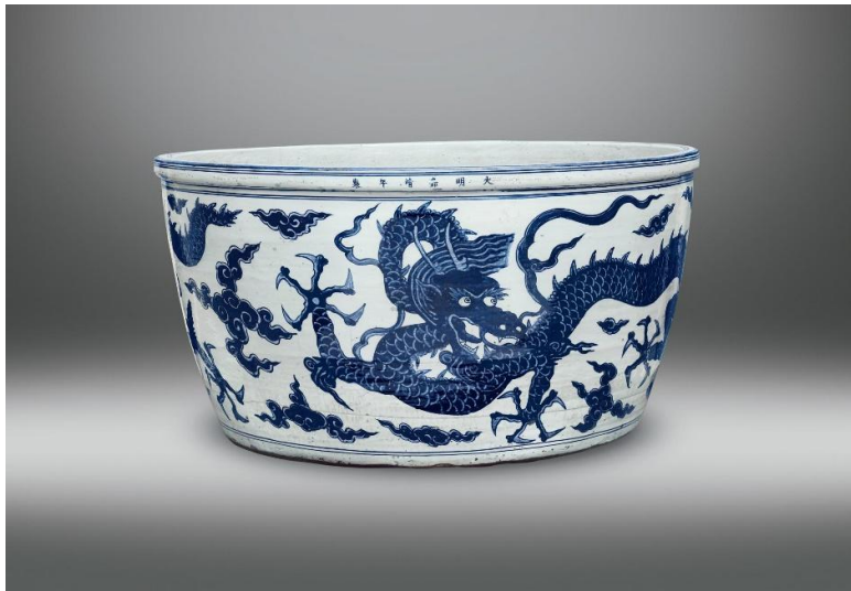
嘉靖青花雙龍紋大缸

當時燒造龍缸，雖然勞民傷財；但並非皇家享樂物品，而是當時皇宮內有實用功能的消防用具。古代中國皇宮磚木結構，易招祝融光顧，所以現在參觀北京故宮，仍見有二百餘座銅或鐵製的大缸，每座可儲水 3000 多公升，謂之「門海」或「吉祥缸」。龍缸其實是明代消防用的「吉祥缸」。