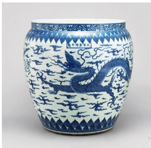
萬曆陵寢中的嘉靖青花龍缸