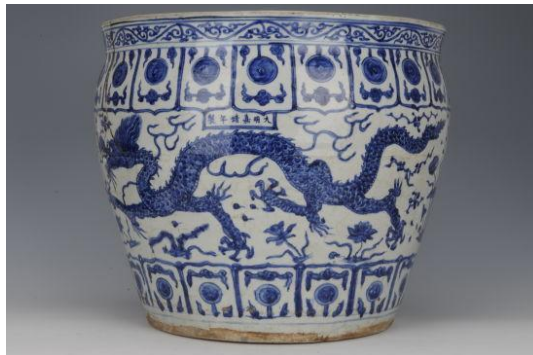
嘉靖青花蓮瓣紋龍缸

1988年，景德鎮考古研究所發掘明官窰遺址，發現1.3米厚的地層藏滿龍缸碎片，總重量達四噸；瓷片雖沒有年款，但按繪畫及青花發色，專家學者判斷，應是正統年間生產的，所以修復了的出土大缸，也命名為「正統青花龍紋大缸」了。這便進一步證實了正統年間，不是沒有製作龍缸，而是沒有成功的龍缸製成品而已。所以光看正統、萬曆二朝，已知雖然各朝的製瓷原料、設備、工具等硬件都無異，但卻不是代代陶工，都能準確掌握同樣燒造技術的。